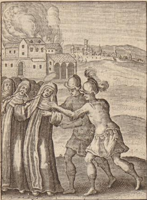
S. EBBA ABBATISSA ORD. S. BEN. Hæc Angla et regij sanguinis, ne in Danorum infidelium libidinem incurreret, nasum et superius labrum sui pro- scidit, cuius exemplum moniales sequuta, simul non in episc igne sunt absumptæ, circa an. DCCCLXX.