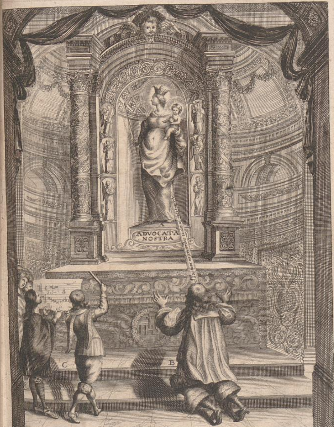
A. Vera Effigies B. V. Glacij in Templo Parochiali S. I. quae ab Ernesto, postea I. Archiepiscopo Pragensi, vultum auertit. B. Ernestus, puer. C. Salve Regina à pueris musicis canitur.