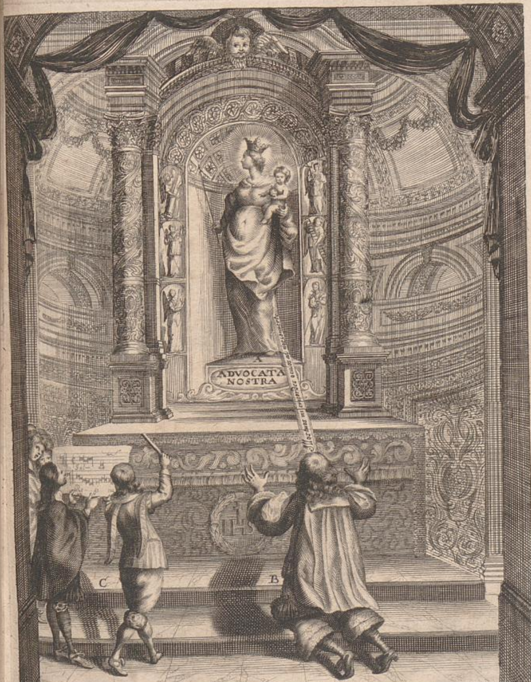
A. Vera Effigies B. V. Glacii in Templo Parochiali S. I. quae ab Ernesto, postea I. Archiepiscopo Pragensi, vultum auertit. B. Ernestus, puer. C. Salve Regina à pueris musicis canitur.