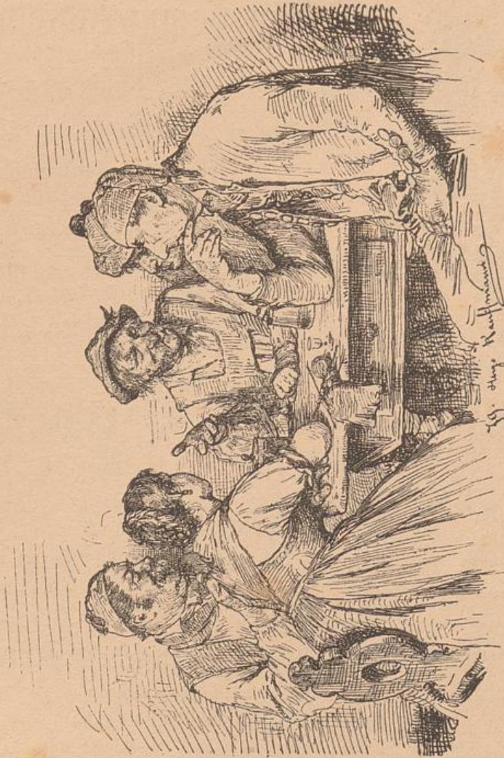
Zeichnung von Hugo Kaufmann. Illustrationsprobe aus „Künstlerlaunen.“