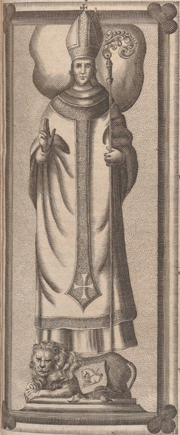
Lapis sepulchralis Ernesti I. Archiepiscopi Pragens: ut olim fuit.