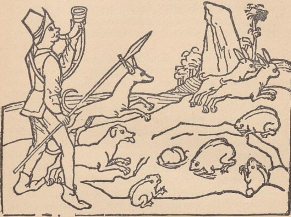
6. AUS DEM AESOP. ULM, JOHANN ZAINER, um 1475.