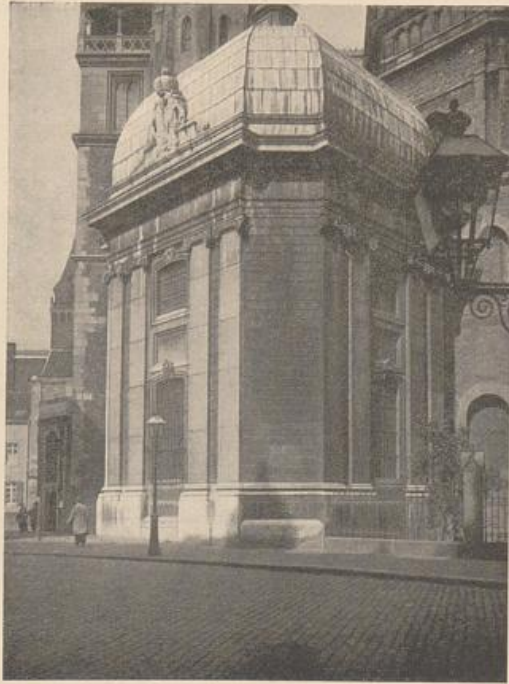
Abb. 133. Aachen. Ungarische Kapelle am Münster, von Moretti. Vgl. Abb. 131.

Die Abb. 134, 135 nach Couvens Originalplänen erläutern die Anlage: a ist der Gerichtssaal, ist neun Meter breit und nimmt die ganze Tiefe der Acht ein (zwölf Meter). Im Hintergrunde führt eine Doppeltreppe zur Tribüne des Vogtmajors und der Schöffen. Der Raum b führt zu den angrenzenden Stiftshäusern und ist vom Chorusplatz zugänglich; ebenso das Vestibül d . Durch das Treppenhaus im Hintergrund von d gelangt man in die über der Acht gelegenen Räume, einen Schulraum und Wohnungen, und gegenüber in die 13,5 Meter tiefe Bühne des Komödienhauses, für die Couvens Entwurf