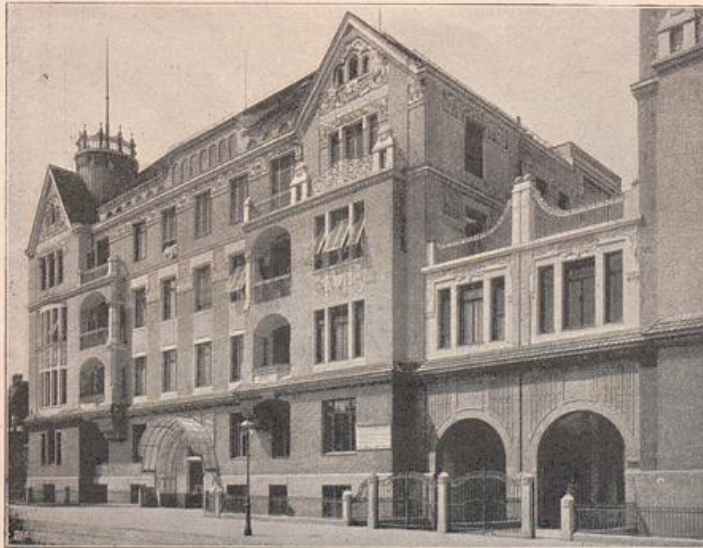
Fig. 16. M. Dülfer: Häusergruppe an der Friedrichstrasse, München. Nach »Münchener bürgerliche Baukunst der Gegenwart«, Verlag von L. Werner, München.

Das Eisen bietet für die Konstruktion so ganz außerordentliche Vorteile, daß es längst im Steinbau Verwendung findet. Und doch unterliegen, wie oben bemerkt, Stein und Eisen so verschiedenen Bedingungen, daß sie nicht leicht nebeneinander zu verwenden sind. Viele Baumeister behelfen sich damit, daß sie das