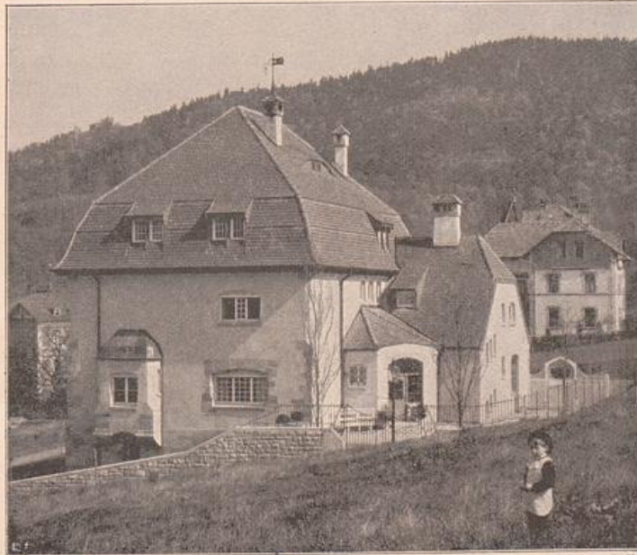
Fig. 19. R. Riemerschmid: Haus Fiesers in Baden-Baden, Gartenansicht.

macht es sich auch unter der Putzhülle doch bemerklich und verrät sein Dasein. Es hat daher ein Recht, in den Formenbildungen angedeutet und ausgesprochen zu werden. Das haben moderne Architekten auch geleistet. »Vor van de Veldes Putzformen (Fig. 12) erkennt man sofort, daß Eisen darunter ist; sie sind