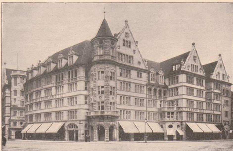
Fig. 23. Heilmann und Littmann: Warenhaus H. Tietz, München.

Moderne hintüber und bildete den Typus nach heimischen Bedürfnissen aus. Es entstanden in allen Gauen, soweit die deutsche Sprache erklingt, eine unübersehbare Zahl schöner Wohnhäuser (Fig. 16—19) voll des höchsten Reizes, worin die Architektur sich wahrhaft als Raum- und Wohnungskunst erweist. Ein Vorzug muß noch besonders erwähnt werden. Bei jedem Neubau stellt sich der richtige moderne Baukünstler die Frage: Was entspricht der heimischen Ueberlieferung, der Heimatkunst? Was fügt sich am besten dem Landschaftsbilde ein? Was paßt am ehesten zur nächsten örtlichen Umgebung? Auch in dieser Beziehung wird auf allseitige Harmonie und Stimmung das größte Gewicht gelegt. So entstand das moderne Privathaus, in welchem das Wohnen zur Lust und Freude wird, zum behaglichen, heimlichen Verkehr im Innern und zur innigsten Beziehung mit der Natur und der Außenwelt. Wäre oft nur die deutsche Gründlichkeit nicht! Es liegt im Charakter des Deutschen, das Vorzügliche noch vorzüglicher machen zu wollen und es zu steigern, bis es — ins Gegenteil umschlägt. Wir haben Villen mehr als genug, wo die Einfachheit zum Dürftigen und Bäuerischen, die malerische Gruppierung zum tollen Wirrwarr, die Mannig-