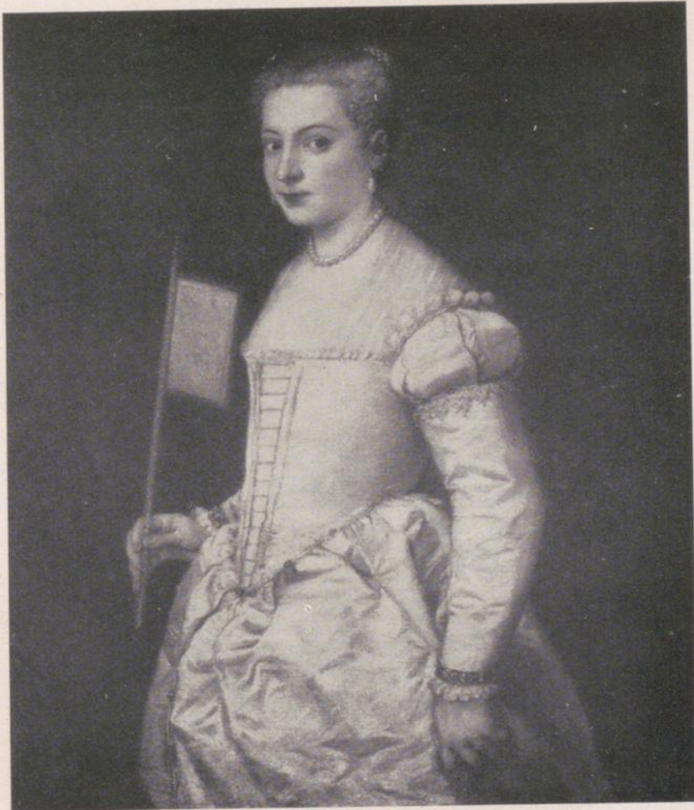
Lavinia als Braut