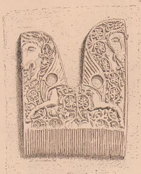
PEIGNE LITURGIQUE EN IVOIRE. (Trésor de la cathédrale de Cologne.) Dessin de E. Rivoalen.

purement géométrique, est resté trop apparent. De plus près encore, la raideur de l'exécution et la nudité des portails achèvent de vous désenchanter. La statuaire, à Cologne, est à peu près absente, et, en regard de cette indigence, on songe involontairement à la prodigieuse floraison de sculptures, à tout ce peuple de statues qui, à Chartres, à Amiens, à Paris et à Reims, décorent nos cathédrales.