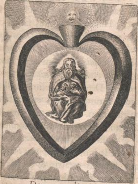
Deus cordis mei, ô Beata Trinitas!

Cor signatum noui Dauidis creati secundum cor Dei Creatoris Patris, luminum.