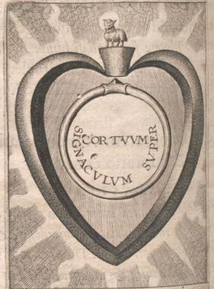
Futare nobis glorię pignus datur. Cor signatur, anima coronatur.

Cor Agno & annulo signatum in cultum pignoris gloriæ conferendæ à Redemptore.