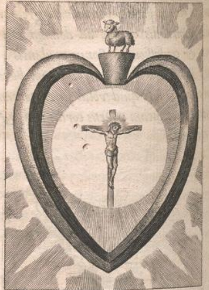
Agnus pascue deputatur; Corde Christus sumitur.

Cor signatum Agno & Hostia in cultum Christi Redemptoris.