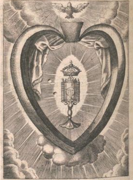
Deus cordis mei, ô sacrum conuinium!

Cor signatum noui Dauidis redempti, & c. fecti secundum cor Dei Redemptoris.