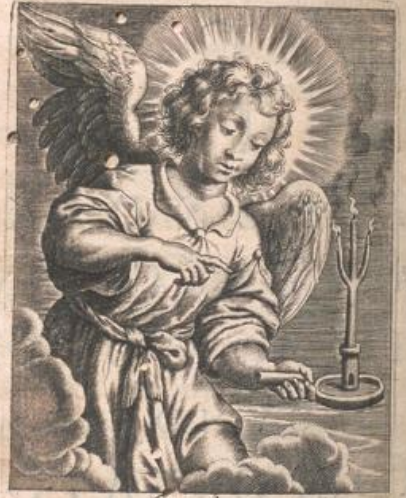
Angele Dei Custodi, Illumina, et Regge.