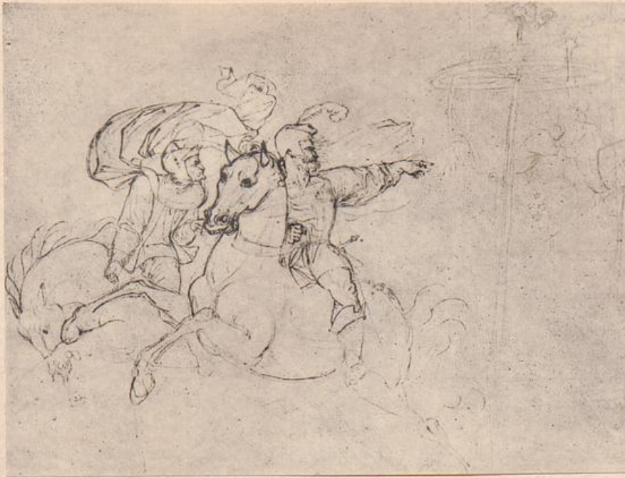
Faust und Mephisto am Rabenstein, Entwurf.

hatten, erschien es im achten Bande der ersten von Cotta verlegten zwölfbändigen Ausgabe.