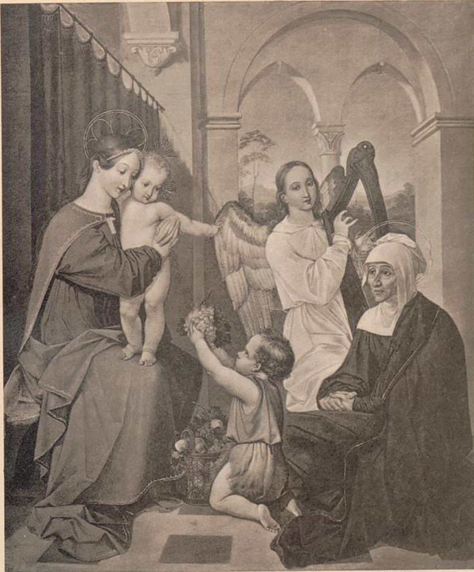
DIE HEILIGE FAMILIE GEMÄLDE