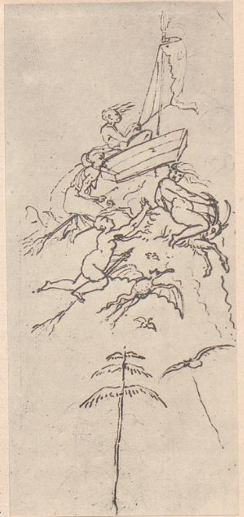
Hexen zum Brocken fahrend, Entwurf.

Goethe und die Romantik Wie tief im Zentrum seines Wesens Goethe verletzt war durch die Mißerfolge seiner Unternehmungen und das Aufkommen eines Kunst-