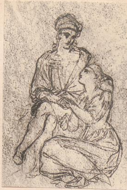
Glaubst Du an Gott? Entwurf.