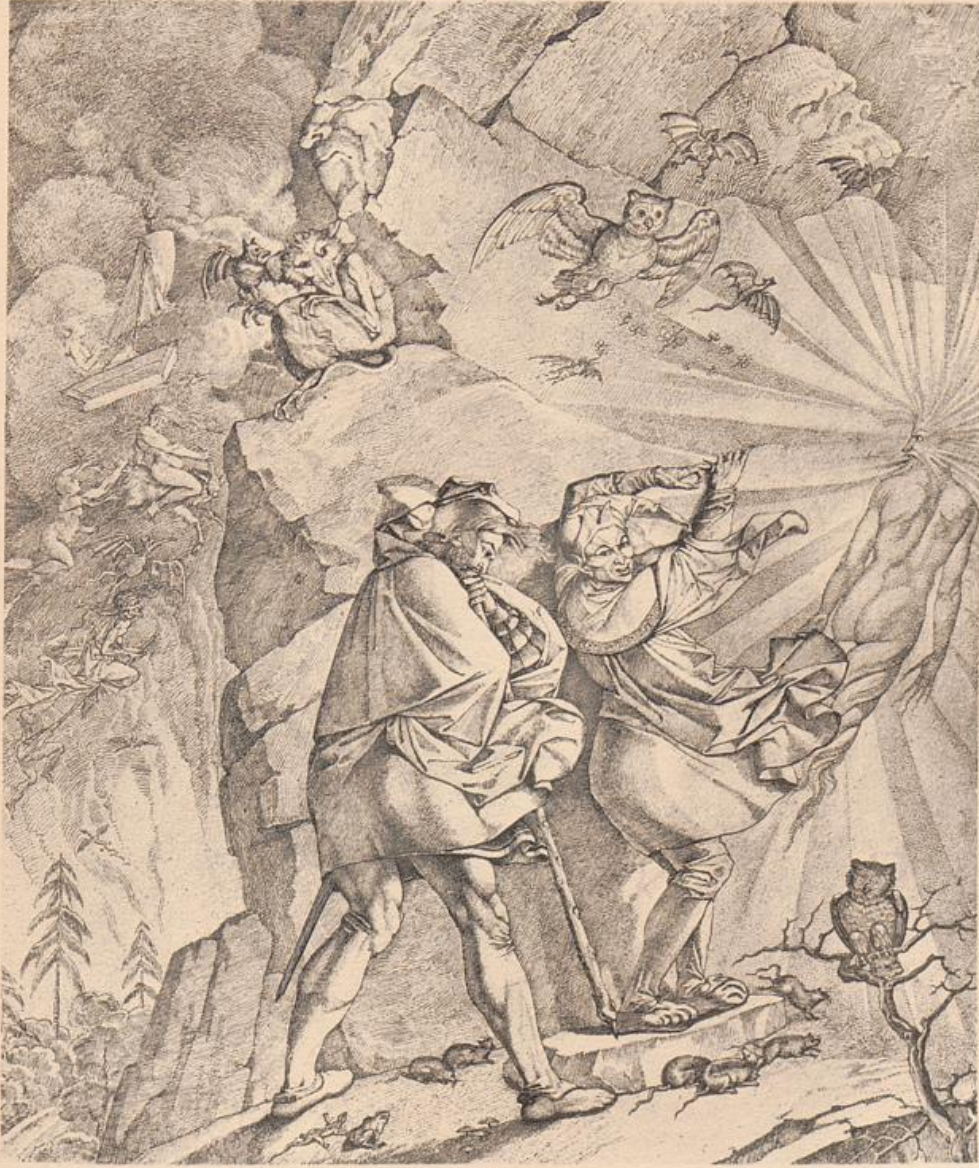
FAUST UND MEPHISTO AUF DER FAHRT NACH DEM BROCKEN ZEICHNUNG