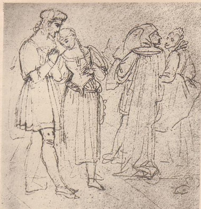
Die beiden Paare in Marthes Garten, Entwurf.

ganz im Menschlichen empfunden in ihrem Erschrecken, ihrer verletzten Mädchenwürde, ihrer Unschuld. Ihr gegenüber Faust als Stutzer, durchaus skrupellos, „fast wie ein Franzos.“ Die altdeutsche Familie links ist Dekoration, Mephisto vor der Domtür verunglückt. Die Armbewegung Faustens sehr expressiv.