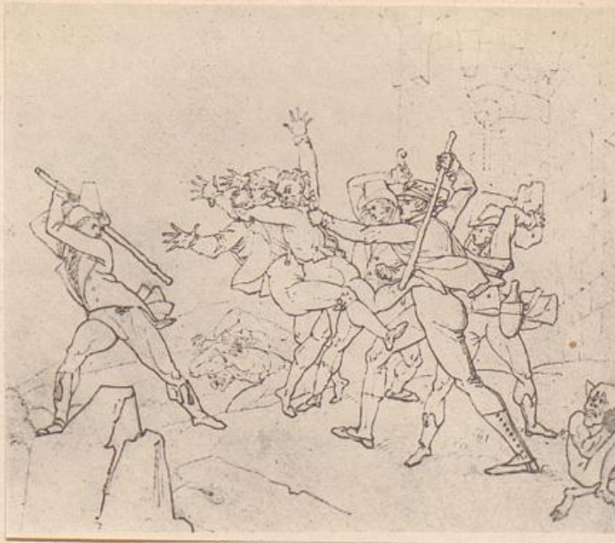
Schlacht auf Burg Königstein, Aus der Taunusreise.

Weitere Ur- teile Goethes über die Faustillu- strationen