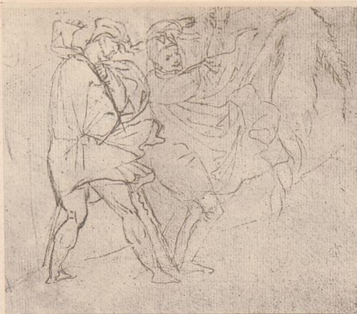
Faust und Mephisto auf der Fahrt zum Brocken, Entwurf.

raffaelischer Art und klassischer Idealität, dann hatte der junge Franz Pforr aus Wien 1808 seinen „Wallenstein in der Schlacht bei Lützen“ und seinen „Tell“ nach Frankfurt gesandt, und 1810 war „Rudolf von Habsburg und der Priester“ entstanden. Auch sein „Götz“ war schon bekannt geworden. Goethe hatte die Zeichnungen im Herbst 1810 schon gesehen. Gewiß, in ihnen lagen Beziehungen zu den Faustblättern. Wahrscheinlich hat Cornelius sie sogar selbst kennen gelernt. Trotzdem liegt hier etwas ganz anderes vor. Die Formensprache, und das ist der künstlerisch objektivierte Geist der Pforrschen Blätter, hat mit den Faustillustrationen nichts zu tun. Bei Pforr noch immer die klassischen Ausgeglichenheiten, die weichen Linien, die ruhig gelagerten Massen der Renaissance, bei Cornelius die sperrigen Bildungen eines revolutionären Geistes, der in das Gegenteil sich stürzt. Eine Bewußtheit, ein Trotz, eine Akademiefindlichkeit, eine Auflehnung gegen Rokoko und Klassizismus, eine souveräne Ver-