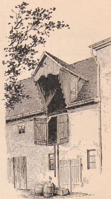
Abb. 145. Ladeluke im Hofe Altstädter Markt 32.

Den denkbar größten Gegensatz zu dieser zart und fein geschmückten Fassade bilden die bäuerlich einfachen, eingeschossigen Reihen-