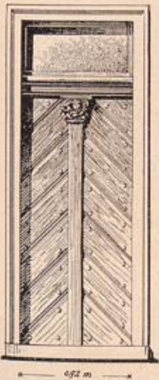
Abb. 146. Altstädter Mühltorstraße 52.