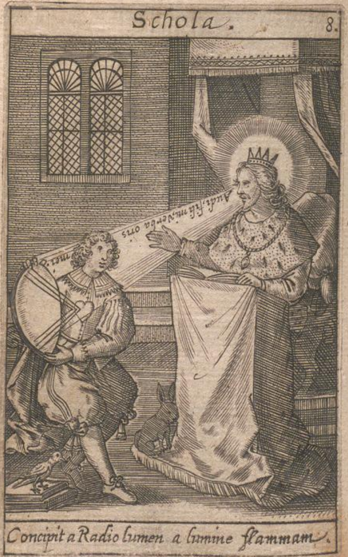
Concipit a Radio lumen a lumine flammam.