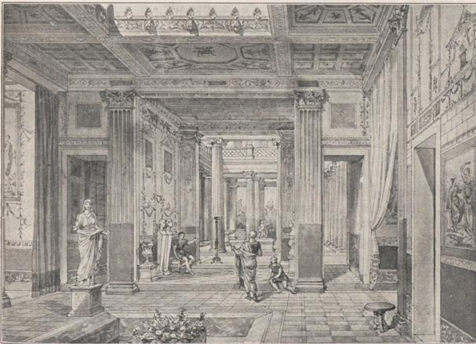
Abb. 137. Das Innere eines römischen Hauses.

das Innere verwiesen. Um das Tablinum gruppieren sich die Höfe — Atrium und Peristyl — und um diese wieder die Konversations-, Empfangs-, Wohn- und Schlafzimmer, die ihr Tageslicht allein von den Höfen aus empfangen; untergeordnete Räume erhalten ihr Licht nur durch die Türöffnungen. Vom Tablinum aus beherrscht der Besitzer mit einem Blick die ganze Anlage nach dem Atrium und Peristyl mit den anliegenden Gelassen — ein wundervolles architektonisches Bild (vgl. Abb. 137) 60) . Höchster Reiz und Vollkommenheit eines bürgerlichen Heims und der Art zu Wohnen.