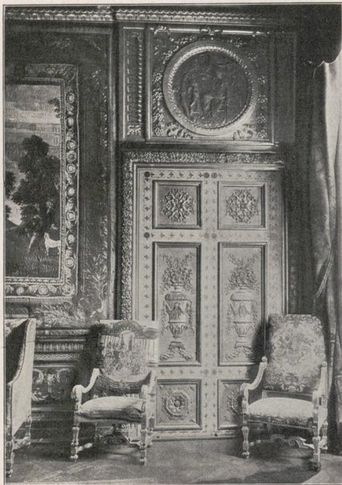
Abb. 150. Zimmer im Palais Lauzain in Paris.

die maskierten Livréebedienten. Die moderne, sog. »Raumkunst«, hat einen neuen, entsprechenden künstlerischen Ausdruck für die Raumbildung und den Raumschmuck noch nicht gefunden und begnügt sich einstweilen — faute de mieux — in verständiger, sachgemäßer Weise mit dem Biedermeiertum und seinen Ablegern oder dem »Wurzelhaften«. Dort passen wir — hoch und nieder — wenigstens noch hinein, nicht aber in pompejanische oder mittelalterliche Gemächer, nicht in die Prunksäle der Renaissance, des Barocko und des Rococo. Letztere sind wohl bei großen Gesellschaften in ihrem Lichtermeer, mit dekolletierten, in Samt, Seide und Brillanten strahlenden Damen, mit Herren in glänzenden Uniformen und galonierten Bediensteten noch zu ertragen. Bei den in historischen Stilen entworfenen Räumen spielen sich unter gleichen Voraussetzungen Maskeraden ab, bei denen Insassen und Räume die Rollen vertauscht haben.