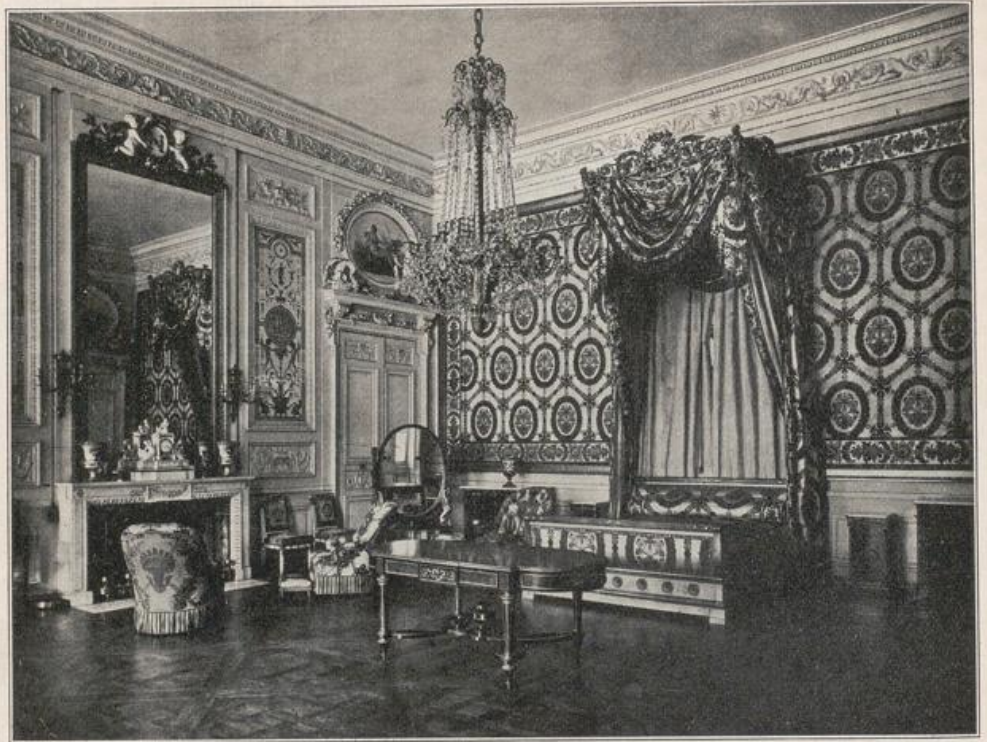
Abb. 152. Schlafzimmer der Marie-Antoinette in Compiègne.

Schloß (Rußland), Abb. 149 das prachtvolle Schlafzimmer Napoleons I. in Fontainebleau.