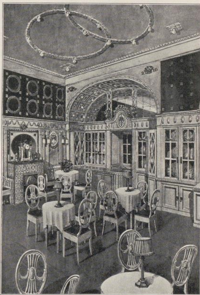
Abb. 154. Grill-Room nach BEMBÉ.

Was die neueste Zeit, auch die Kunst des Wurzelhaften — aus dieser überreichen Erbschaft oft recht gut gemacht hat, mögen die beifolgenden Beispiele zeigen. (Vgl. Abb. 154 u. 155, ein »Grill-Room« im Breitenbacher Hof in Düsseldorf, der »Salon« in einer Wiesbadener Villa und das Speisezimmer eines Landhauses zu Tschiffik Abb. 156 68) von A. BEMBÉ in Mainz.)