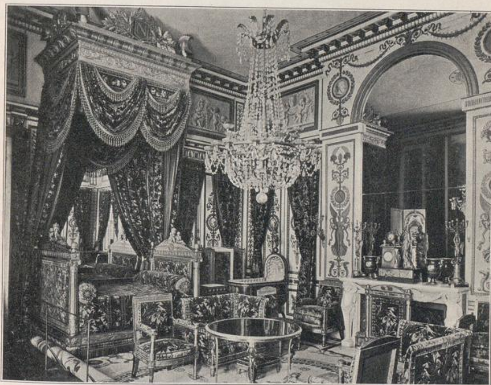
Abb. 149. Fontainebleau. Schlafzimmer Napoleons I.

Louis XIV. und XV. werden durch gerade ersetzt, womit wieder die Struktur in der Dekoration in ihre alten Rechte trat. Die antike Wanddekoration hörte mit der phantastischen alexandrinischen Weise auf, in der französischen erleben wir noch eine rein empfundene Nachblüte, ehe sie zur Erstarrung überging. Jene starb in ihrer Sünden Maienblüte, diese an Altersschwäche.