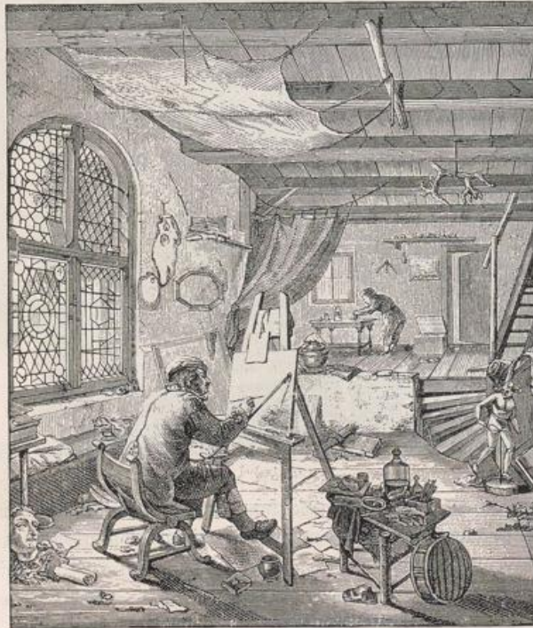
Abb. 153. Maler-Atelier Ostade.

Abb. 150 einen fein durchgeführten Raum im Palais Lauzain zu Paris. Diesem sei zur Beurteilung der Stilwandlung der Salon der Ehren-damen der Königin Marie-Antoinette im Schlosse zu Fontainebleau gegenübergestellt, der, was Farbe und Qualität der Ausführung betrifft, den höchsten Anforderungen genügt. Die Grottesken der Türfüllungen sind auf gelblich abgetöntem Silbergrund buntgemalt, von reizvoller Wirkung, der ganze Raum von ungemein vornehmer Stimmung (Abb. 151).