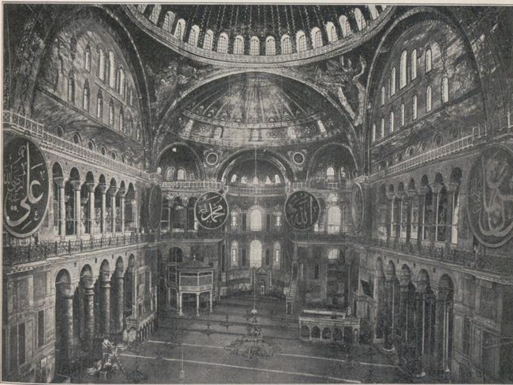
Abb. 174. Inneres der Agia Sofia in Konstantinopel.

zeigen, die wir unter veränderter Art des Lebens, der Weltanschauung, der Religion und der Bedürfnisse zu wandeln haben. Das Bedürfnis meistert die Kunst, aus ihm sproßt neues Leben, es erzeugt neue Formen, worunter aber nicht Modefexerei verstanden sein will, der gefährlichste Gegner jeder Kunstentwicklung zu allen Zeiten, der einem Gourmand gleich, nach stets verfeinerter, abwechslungsreicher Tafel verlangt, um schließlich, wenn alles durchprobiert ist, zur derben Hausmannskost zurückzukehren. Der Bauer kann dabei zeitweilig über den Jäger kommen, wobei wir aber nicht vergessen wollen, daß der Weg zum Hohen und Idealen durch Berg und Tal führt. Wir sehen die Spitze; verlieren wir sie nicht aus den Augen, auch wenn wir beim Blick nach oben zuweilen stolpern sollten.