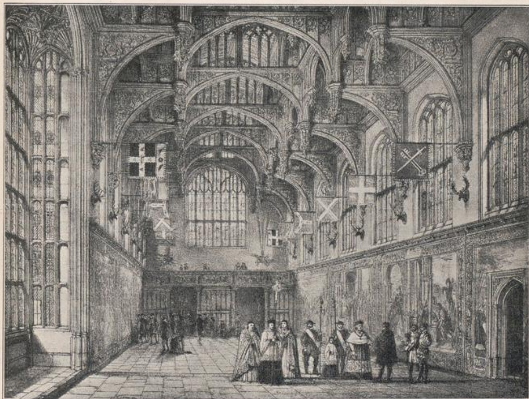
Abb. 178. Halle in Hampton Court.

gleichen, raumbegrenzenden und stützenden Elemente mit gewölbter Decke. Dort senkrechter Druck und Kraft der diesem entgegenwirkenden Stützen, hier Schub und Druck der Gewölbe mit den diesen entgegenwirkenden Anordnungen. Sie sind für den Architekten, was für Maler und Bildhauer der Organismus der Pflanzen- und Gesteinswelt, das Knochengerüst des Wirbeltieres ist. Ihr Studium führt zur Erkenntnis und regt zu Neuem an.