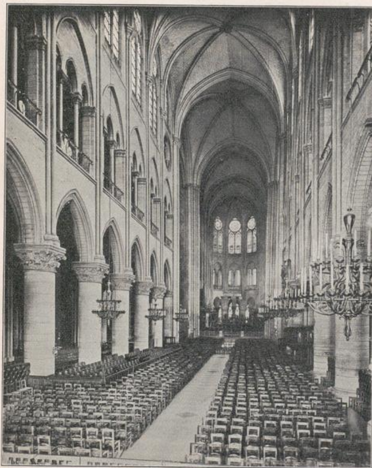
Abb. 175. Notre Dame in Paris nach Photographie von VASSE.

Ding nach der Schule, die ihn den Organismus der Pflanzen und Bäume lehrt, die Formation der Felsen, die Bildung der Wolken, die Wirkung der Farben, von Schatten und Licht. Die »Darstellung des Runden auf der Fläche«, auf Papier, Leinwand, Kalkputz oder Holz ist ein technisches Verfahren, das gelernt sein will und das dem Abschreiben der Natur oder der freien Komposition in gleicher Weise vorausgehen muß. Das Handwerk bildet die Grundlage. Der Maler muß mit seinem Arbeitsmaterial aufs innigste vertraut werden, dessen Wiedergabe beherrschen, will er in voller künstlerischer Freiheit schalten und walten. Wo und auf welche Weise er diese Vorbedingungen erfüllt hat,