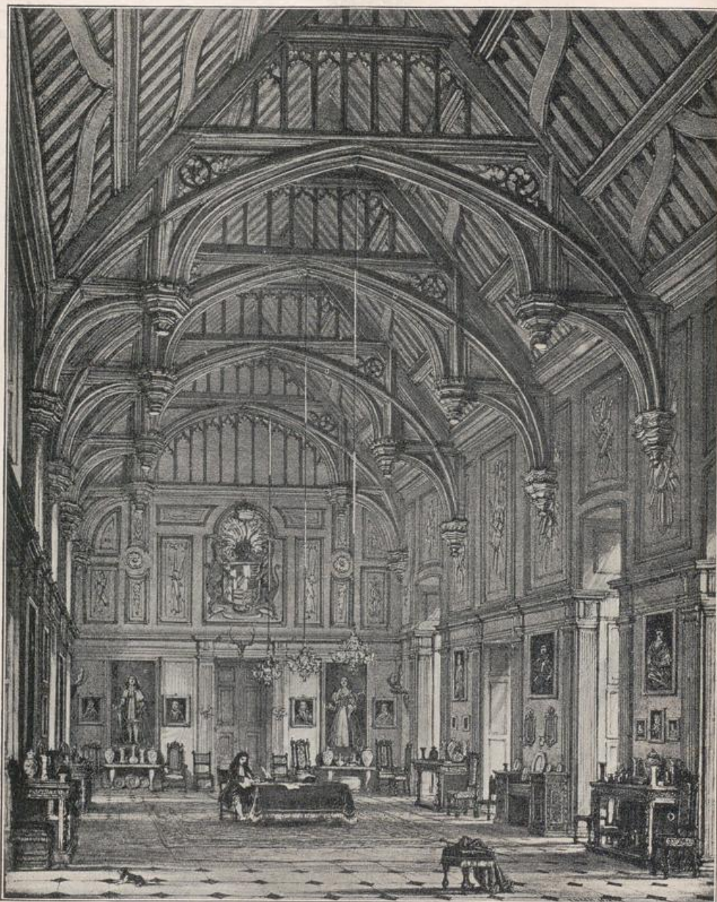
Abb. 177. Beddington-Hall (Surrey).

Menschenhand angewiesen. Sie sind ihm die Elemente seiner Erziehung und künstlerischen Bildung. Wie der Maler das, was ihm die Erde in ihrem Wechsel bietet, der Bildhauer die menschliche Gestalt vom Werden bis zum Vergehen in den Kreis seiner künstlerischen Tätigkeit einbezieht und dementsprechend seine vorbereitenden Studien einleitet, nicht