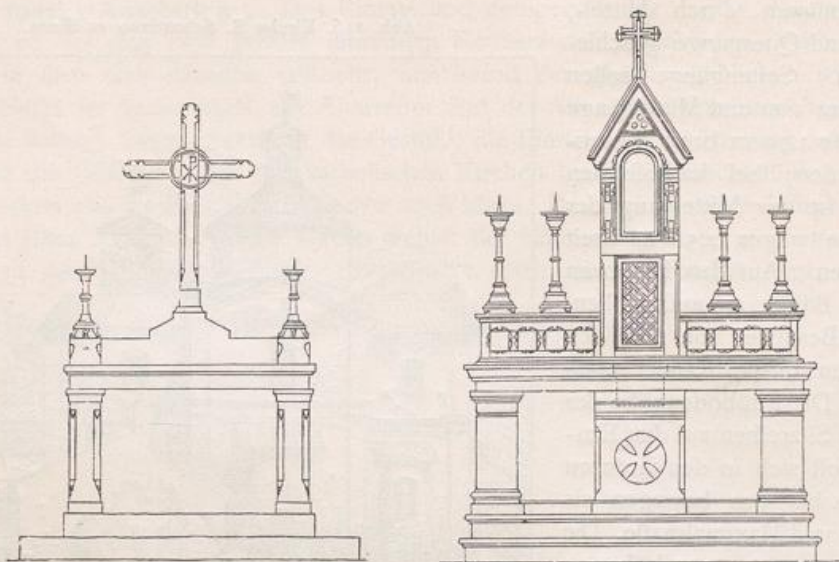
Abb. 249 u. 250. Altarformen.

f) Die Kanzel ist im Schiffe oder am Chorpfeiler je nach der Größe der Kirche aufzustellen. Ihr Fußboden soll nicht unter 1,56 m und nicht über 3,10 m liegen; doch können akustische Verhältnisse auch zu andern Maßen zwingen. Für den Kanzelsarg