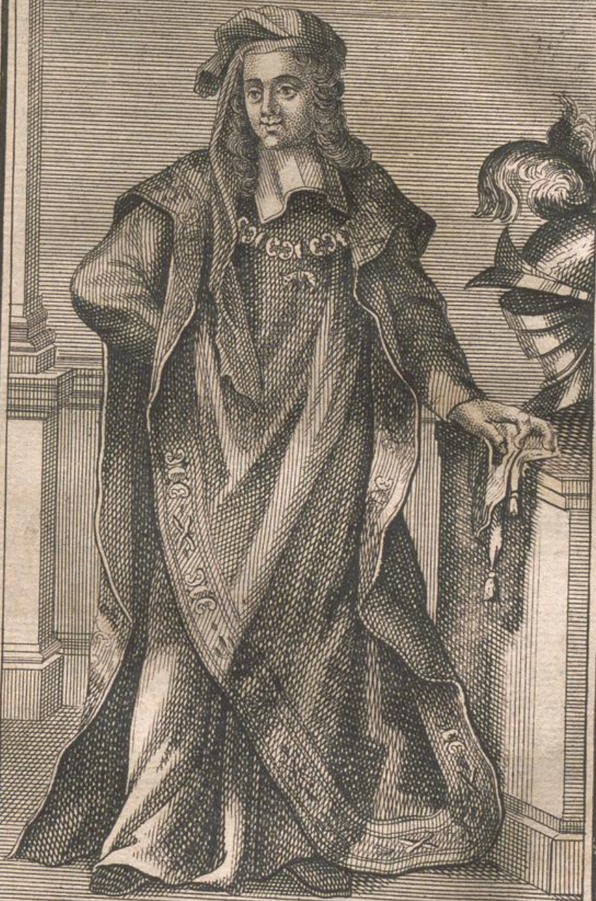
Chevalier de la Toison d'Or.