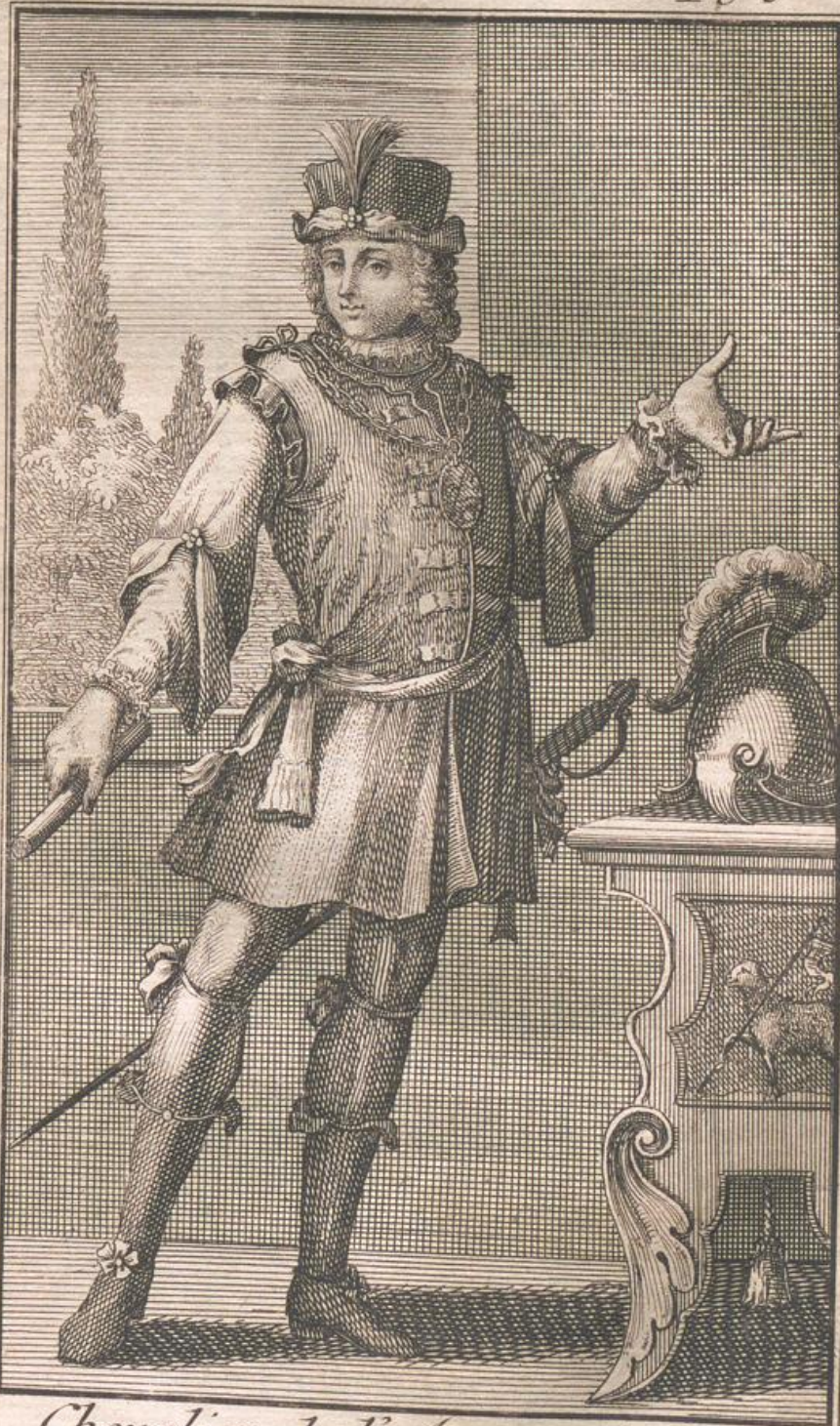
Chevalier de l'Agneau de Dieu.