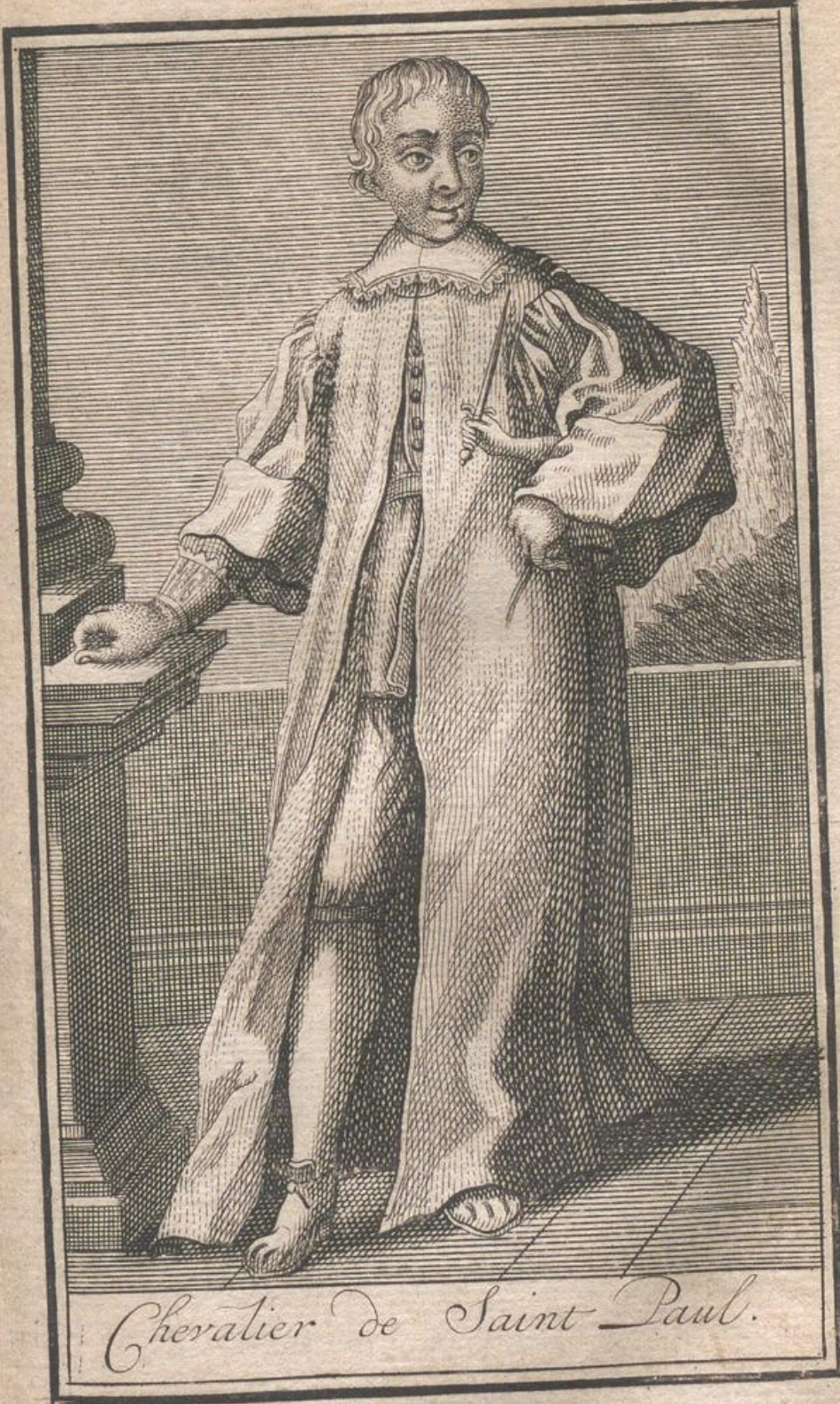
Chevalier de Saint Paul.