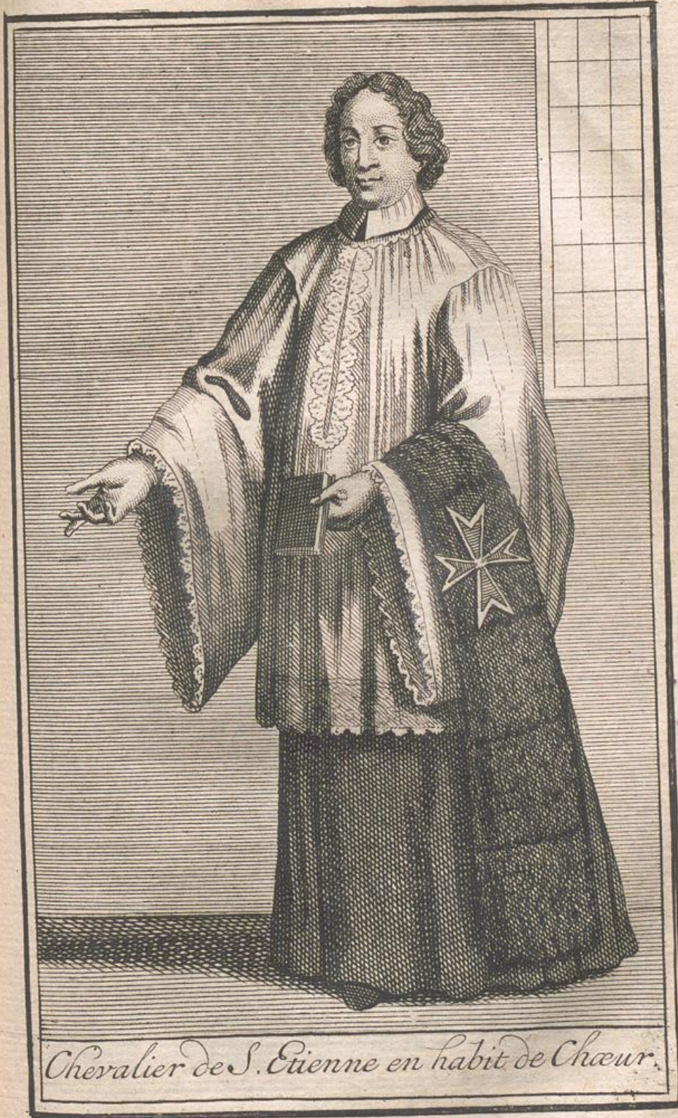
Chevalier de S. Etienne en habit de Chœur.