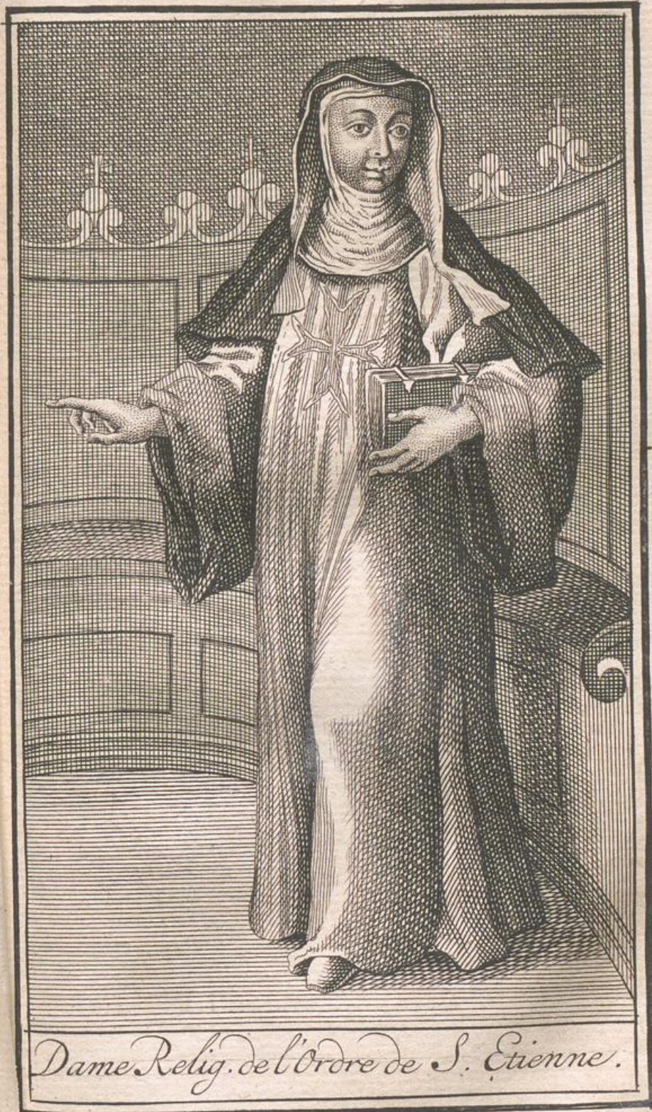
Dame Relig. de l'Ordre de S. Etienne.