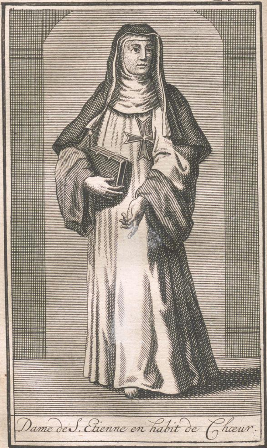
Dame de S. Etienne en habit de Chœur.