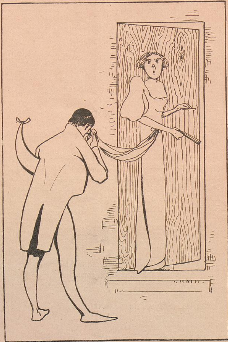
„Der erste Kuß“.