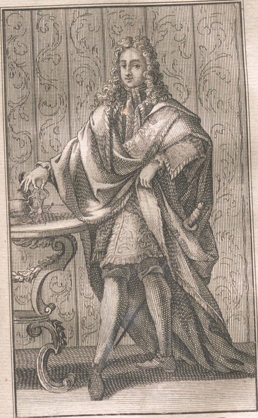
Chevalier du Mont Carmel et de S. Lazare.