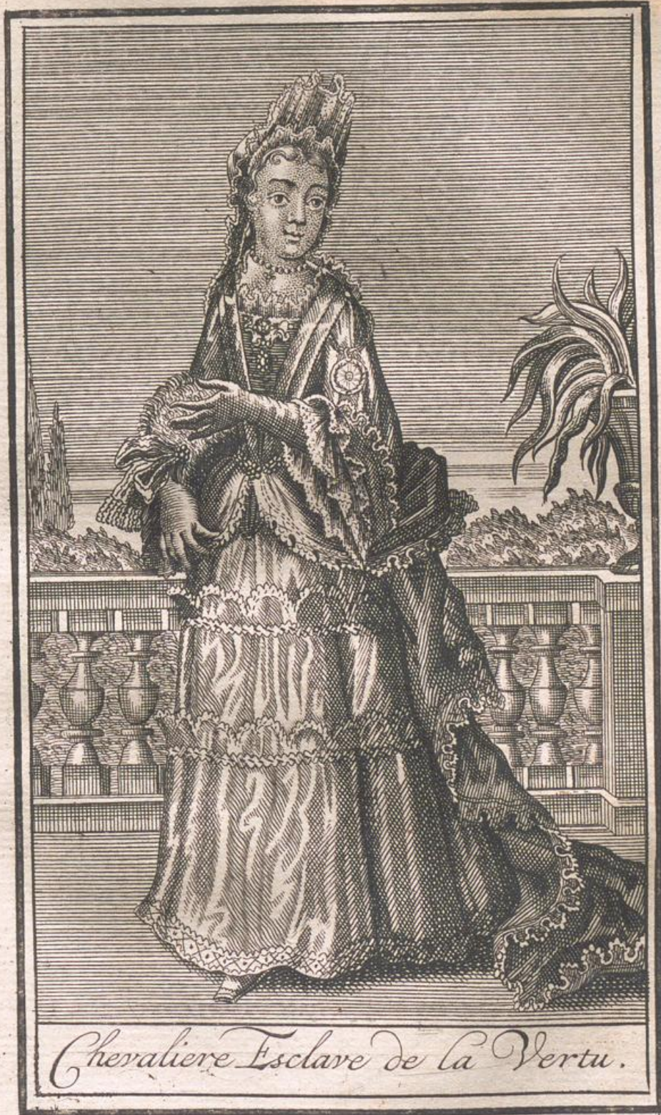
Chevaliere Esclave de la Vertu.