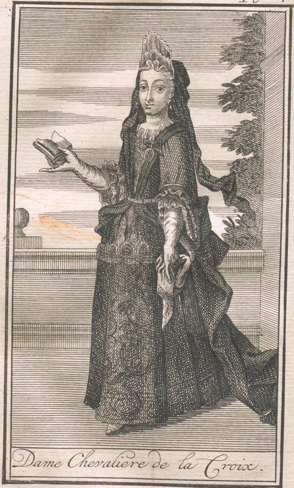
Dame Chevaliere de la Croix.