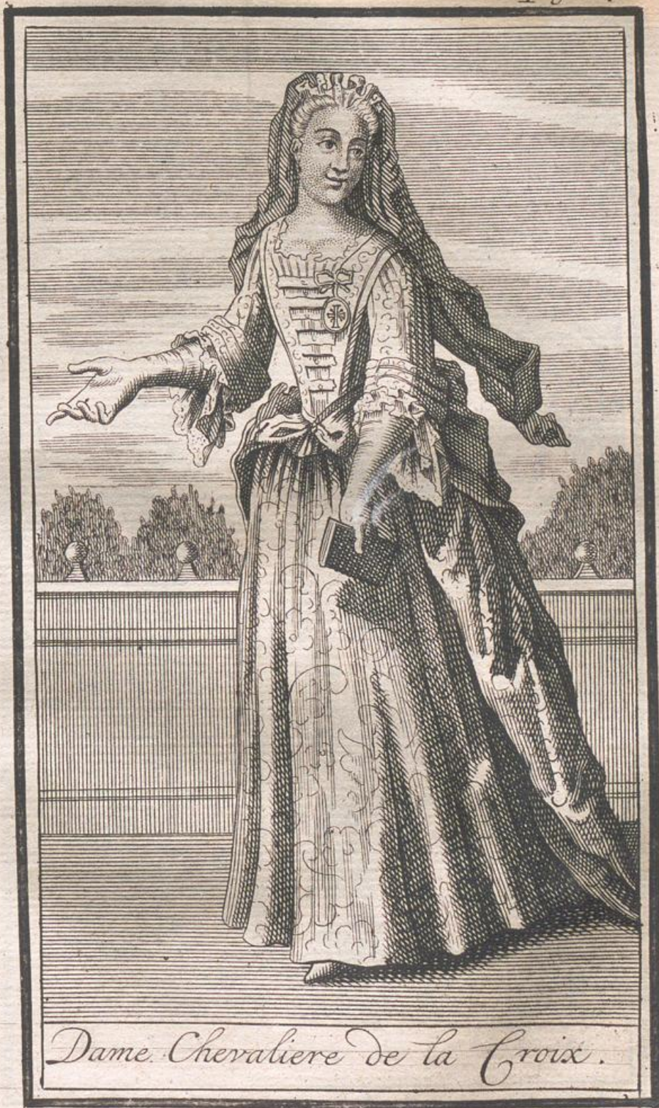
Dame Chevaliere de la Croix.