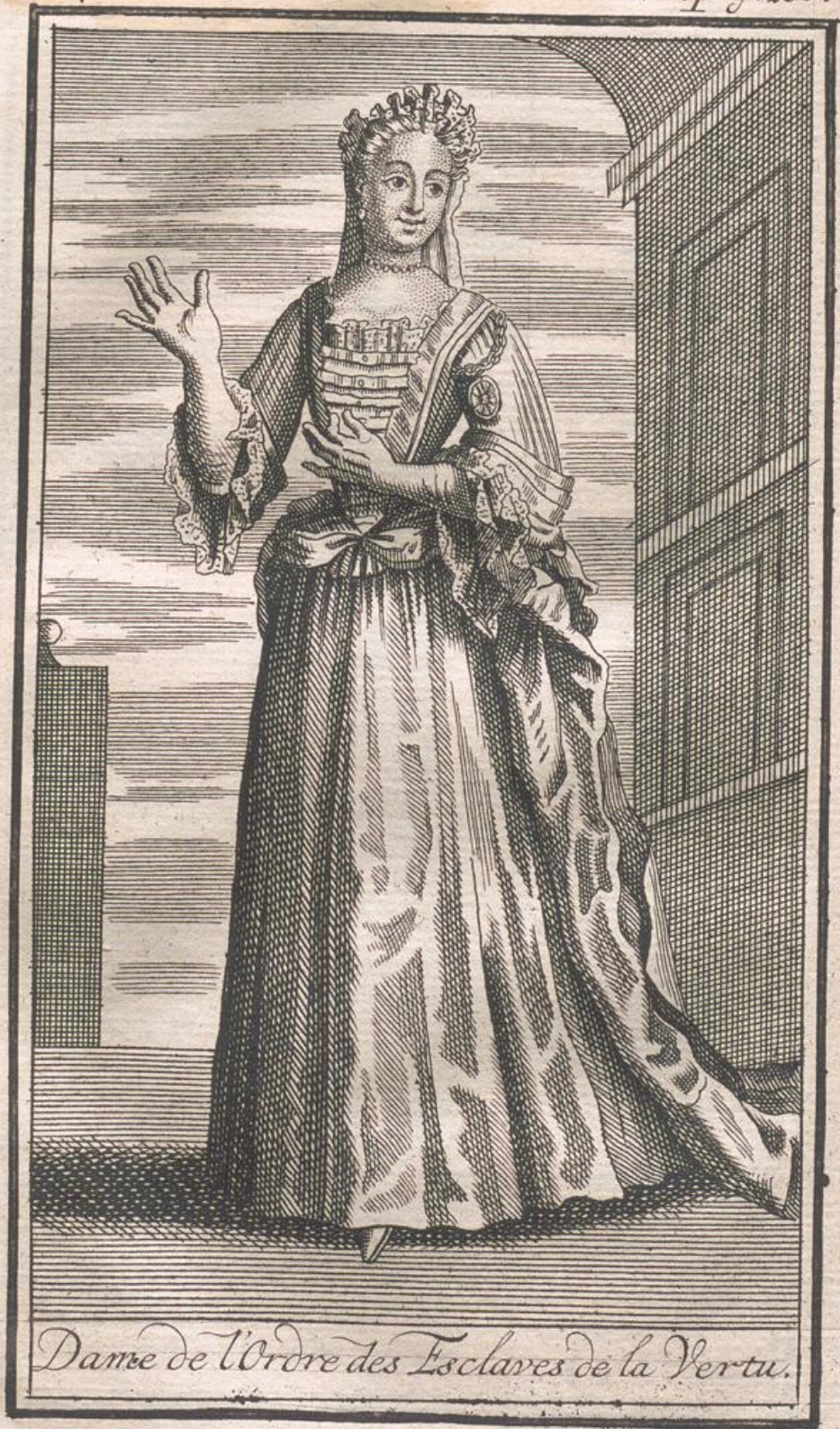
Dame de l'Ordre des Esclaves de la Vertu.