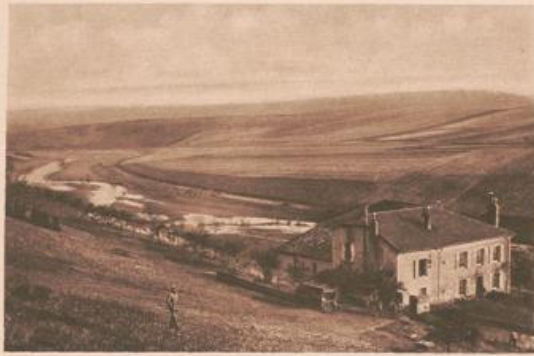
Mühle in Euvezin.