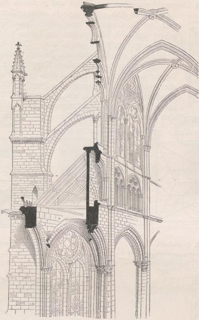
Abb. 393. Rippen-Kreuzgewölbe-Anlage.

auch ein weiterer Schildbogen über der Kämpferhöhe anzuordnen. Solche Gliederung spielte im gotischen Baustil eine große Rolle und führte zu wirkungsvollen Gewölbeformen, bei denen die Nebenrippen schwächer gehalten waren als die Hauptrippen.