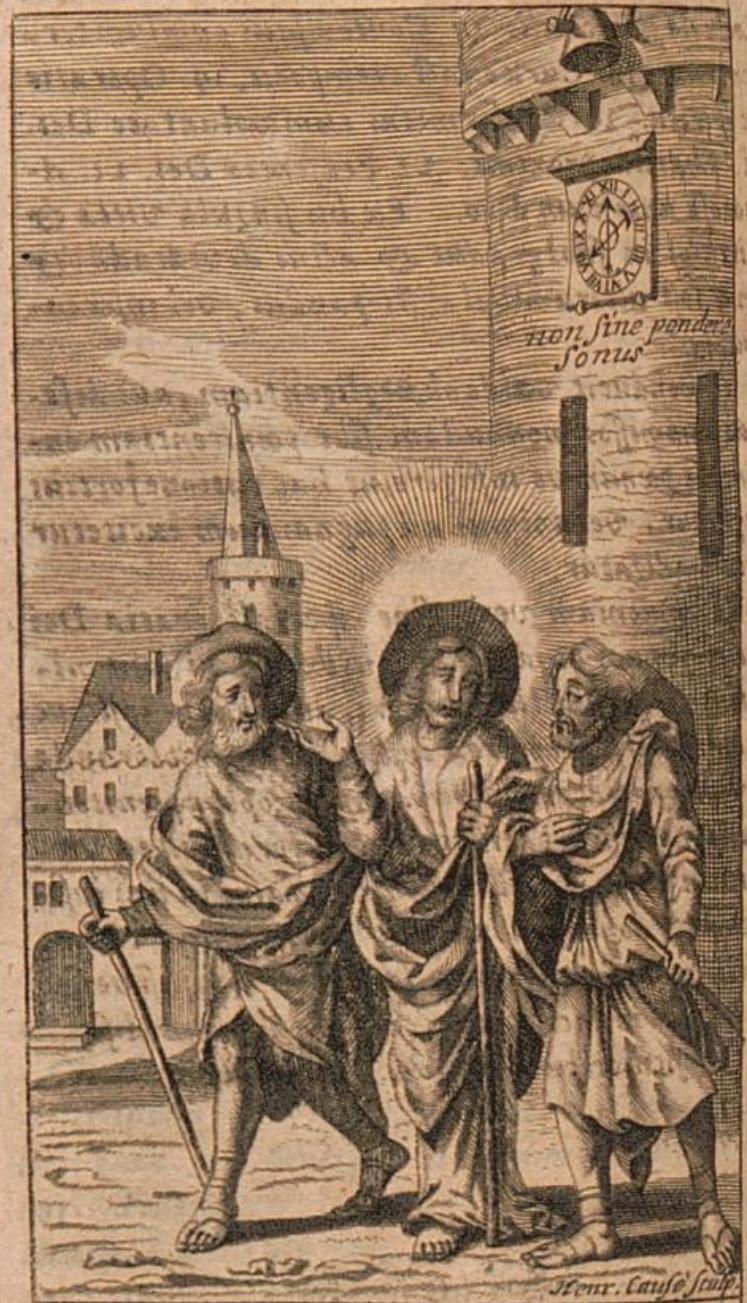
Nonne cor nostrum ardens erat in nobis? Luc. 24.