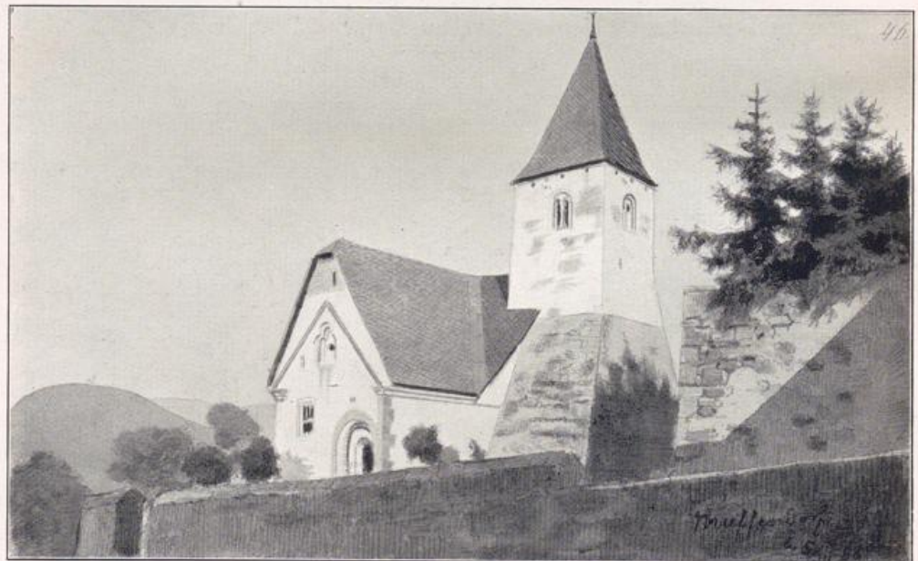
Muffendorf bei Bonn. Die alte katholische Pfarrkirche.

Für sämtliche Jahrgänge der Zeitschrift sind Einbanddecken zum Preise von 2,— Mark durch die Geschäftsstelle zu beziehen.