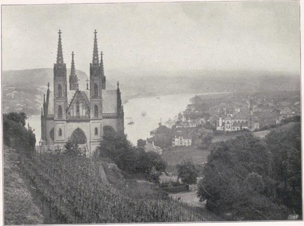
Die Apollinaris-Kapelle zu Remagen.

Heiliger Strom, weil er Symbol vergangener deutscher Reichsherrlichkeit! Ingelheim, Gelnhausen, Kaiserswerth und Nymwegen deutsche Kaiserpfalzen. Mainz Sitz des Erzkanzlers des Reiches. In Rhens der Stuhl der deutschen Kurfürsten. Mainz und Frankfurt der deutschen Kaiser Krönungsstätten, der hochragende Dom zu Speier ihre Grabeskirche. „Auf nach Speier!“ war ihr Grabgeläute. Dome, Kirchen, Klöster, Burgen, Schlösser und malerische Städtebilder, die sich im Strome spiegeln, sind des Deutschen Reiches monumentale Geschichtsurkunden und in der Überfülle ihrer Schätze eine lückenlose Darstellung der Geschichte der Kunst auf deutschem Boden seit der Römer Tage bis auf die Gegenwart der Brücken-, Hoch- und Industriebauten. Köln, unbestritten Haupt und Herz des Landes, war wegen des Reichtums seiner Kirchen, des vielgestaltigen Diadems, das es um seine Stirn gewunden, das „Hillige Coellen“ genannt. Hoch im Norden in Kleve die Burg des Schwanenritters. Xanten und Worms der Schauplatz der Nibelungen Not. Im Rhein, verklärt durch Sage und Geschichte, durch Kunst und Natur, liegt der Schatz der Nibelungen, der Nibelungen Hort. Er war und bleibt das Herz des Reiches und in Tagen politischer Ohnmacht die Sehnsucht des Reichsgedankens, wie in den Tagen der Romantik so auch heute. — „Es liegt eine Krone im tiefen Rhein“ — Heiliger Strom!