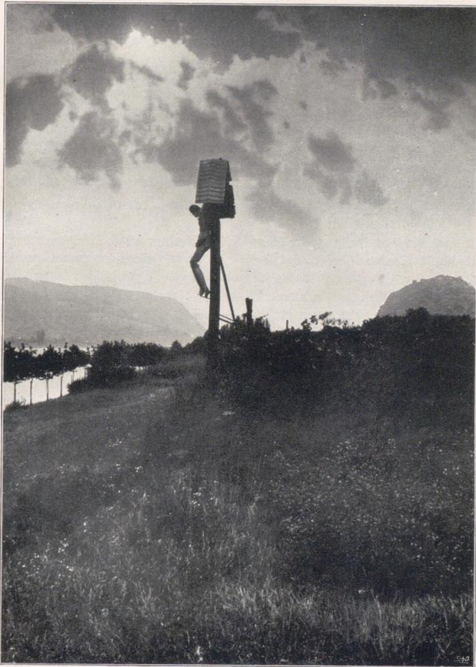
Wegekreuz am Mittelrhein. Im Hintergrunde rechts Burgruine Hammerstein.