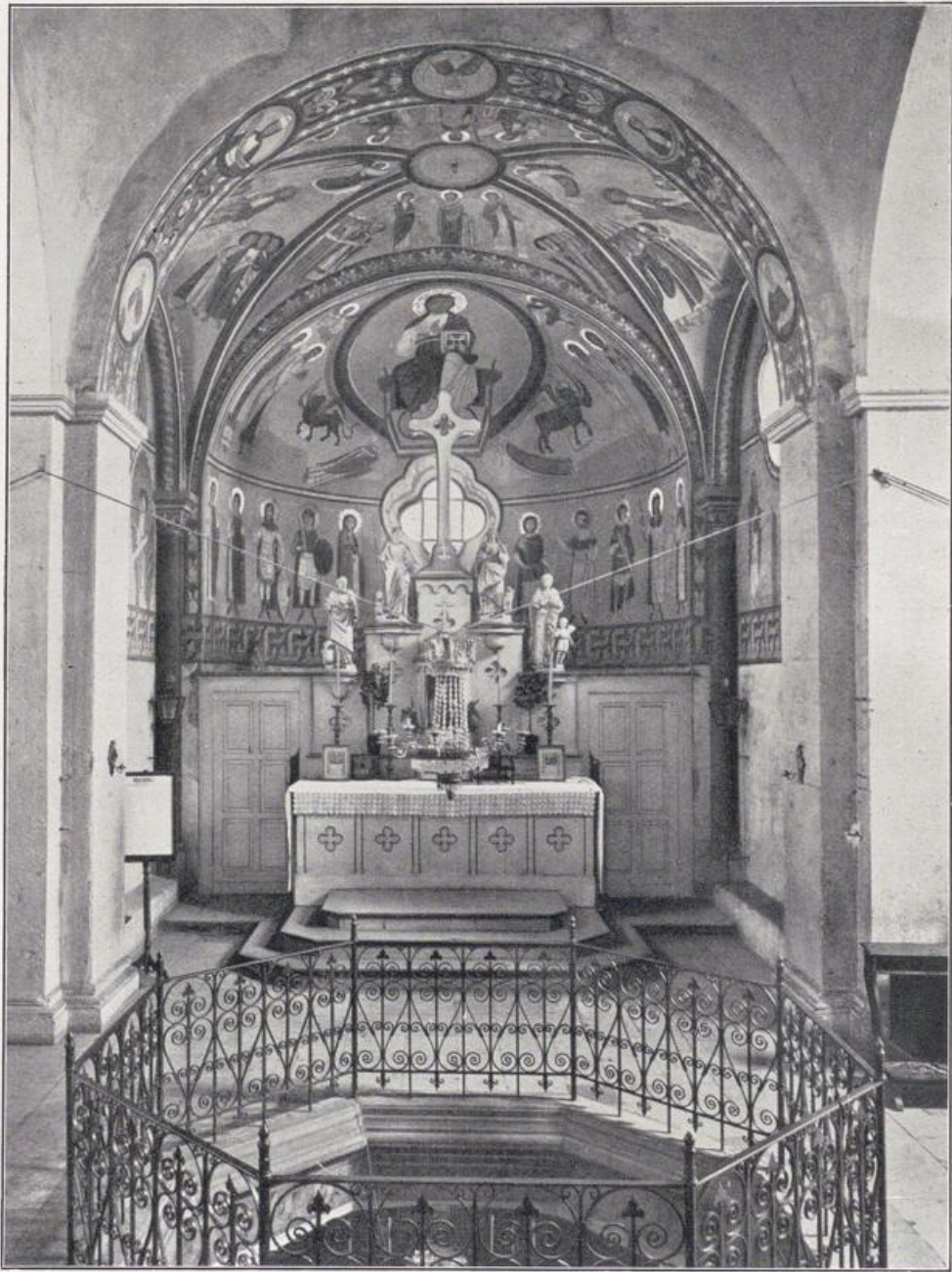
Schwarzrheindorf. Oberkirche. Unterkirche siehe Seite 5.

schöne Band der rings um die Kirche laufenden Zwerggalerie. Darüber das wirkungsvoll gegliederte Gesims mit seinen Konsolen. Rundbogenfries und Konsolen schmücken das Mittelschiff; Nischen, von Säulen flankiert, die Giebel der Seitenschiffe; Blendbogen und Säulen das Chorrund. Statt der kahlen Flächen der Unter-