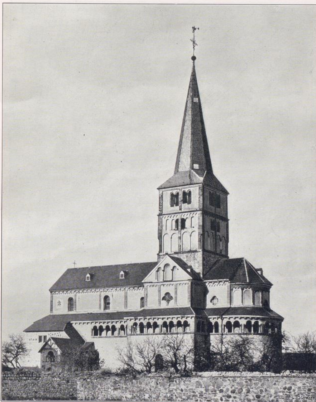
Doppelkirche zu Schwarzrheindorf.

Weihe 1151 als Burgkapelle. Anbau an das Langhaus 1173. Inneres siehe Seite 4 und 5.