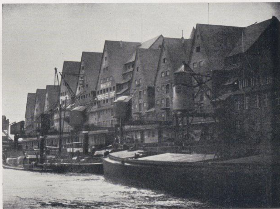
Köln. Die neuen Lagerhäuser am Rhein von Hans Verbeek.