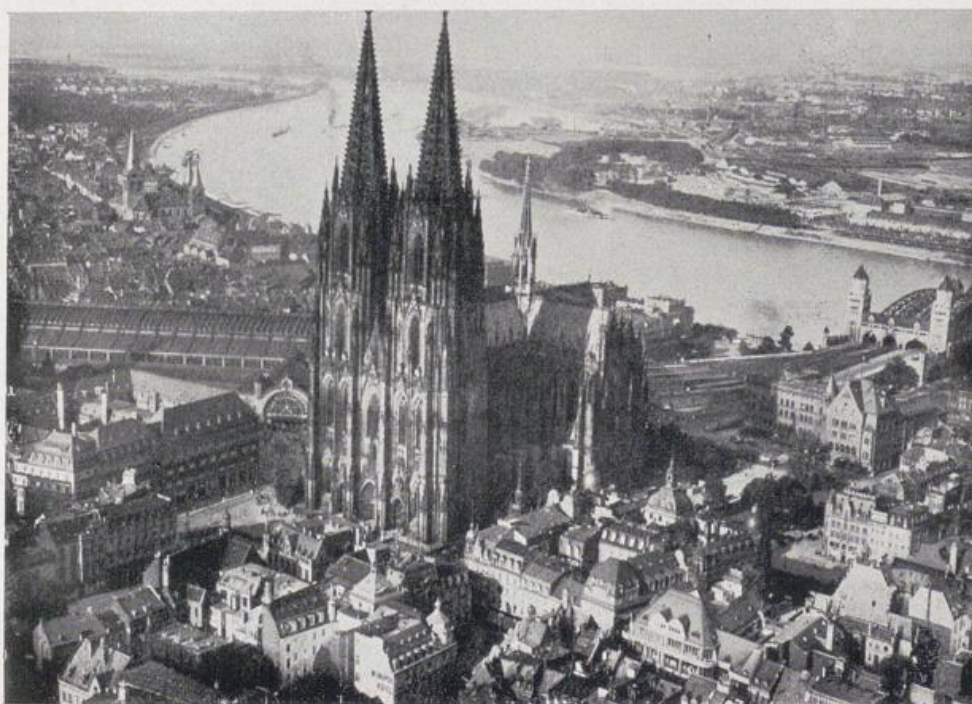
Der Dom zu Köln.