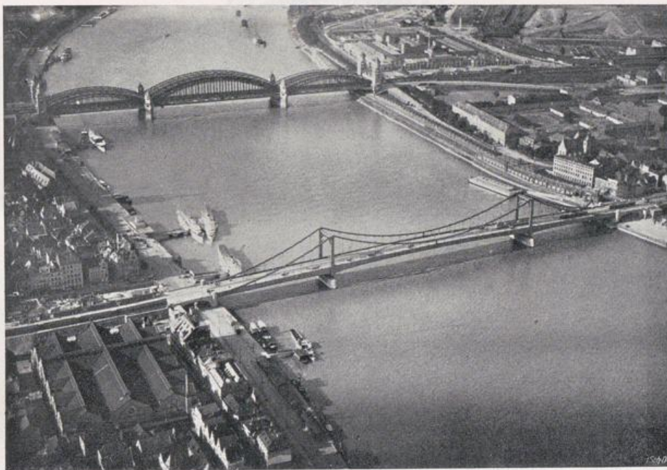
Köln. Blick auf die Neue und die Hohenzollernbrücke.