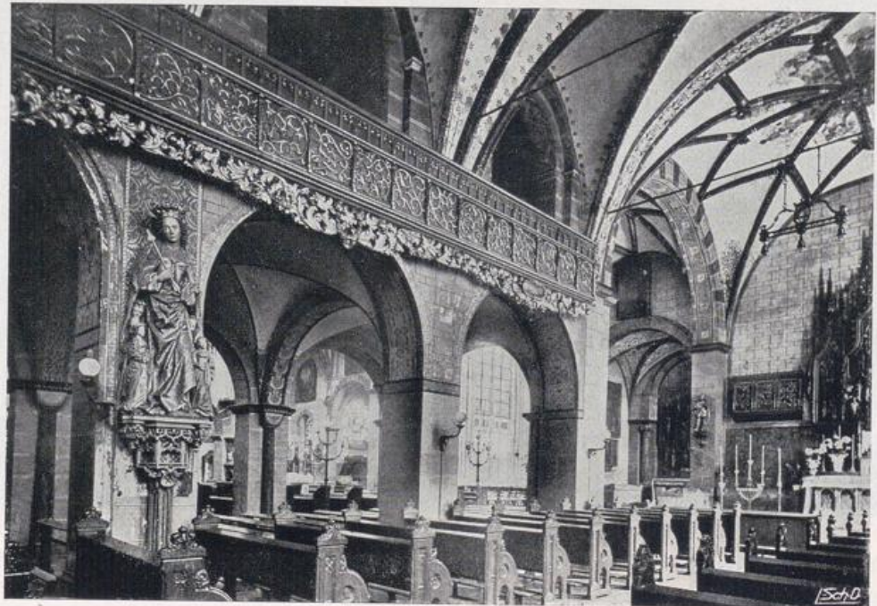
Köln — Ursulakirche.

Durch stille Straßen und Gassen, den Ursulaplatz, Stolkasse und Hunnenrücken, wandern wir zum Maria-Ablaß-Platz. Aus seiner Mitte erhebt sich die schlichte, kleine St.-Maria-Ablaß-Kirche. Die Eintrachtstraße führt weiter zur GereonsträÙe. Dort, wo beide Straßen sich begrüÙen, erhebt sich das Erzbischöfliche Palais, früher das Haus des Bürgermeisters Balthasar von Mülheim (1758), vornehm zurückhaltend im Geiste des Aufklärungszeitalters der zweiten Hälfte des 18. Jahrhunderts, das sich auf behagliche Wohnlichkeit einzustellen wußte. Heinrich Nikolaus Krakamp, der damals reich beschäftigte Kölner Baumeister, hat den Bau entworfen. Nach dem rückwärts gelegenen Garten zwei Flügelbauten, anschließend an den einen Flügel das Wirtschaftshaus an der Ecke der Eintrachtstraße. Ein Giebel hebt die drei Mittelachsen aus der Front des Herrenhauses hervor. Gewundene Schlangen haben die Laternen des Hauptportales zu halten. Aber schnell huscht das Auge über diese vornehme Schlichtheit hinweg, denn am Ende des StraÙenzuges fesselt ein Bau unser Auge, das ganze StraÙenbild beherrschend. Zwei schlanke Türme rahmen eine typische Kölner Chorapsis ein. Dahinter steigt ein Kuppelbau auf — St. Gereon (Bild S. 95).