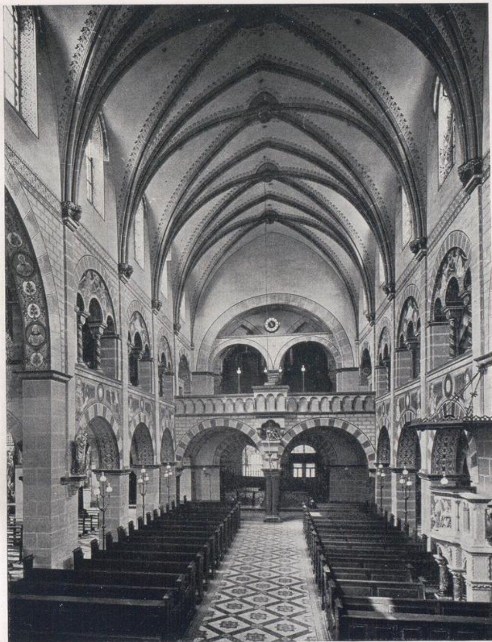
Köln — Ursulakirche.

Blick vom Chor (s. S. 93) auf den Westbau. Älteste rheinische Emporenbasilika Anfang des 12. Jahrhunderts, ehemals flachgedeckt über den Emporen. Wölbung Anfang des 14. Jahrhunderts.