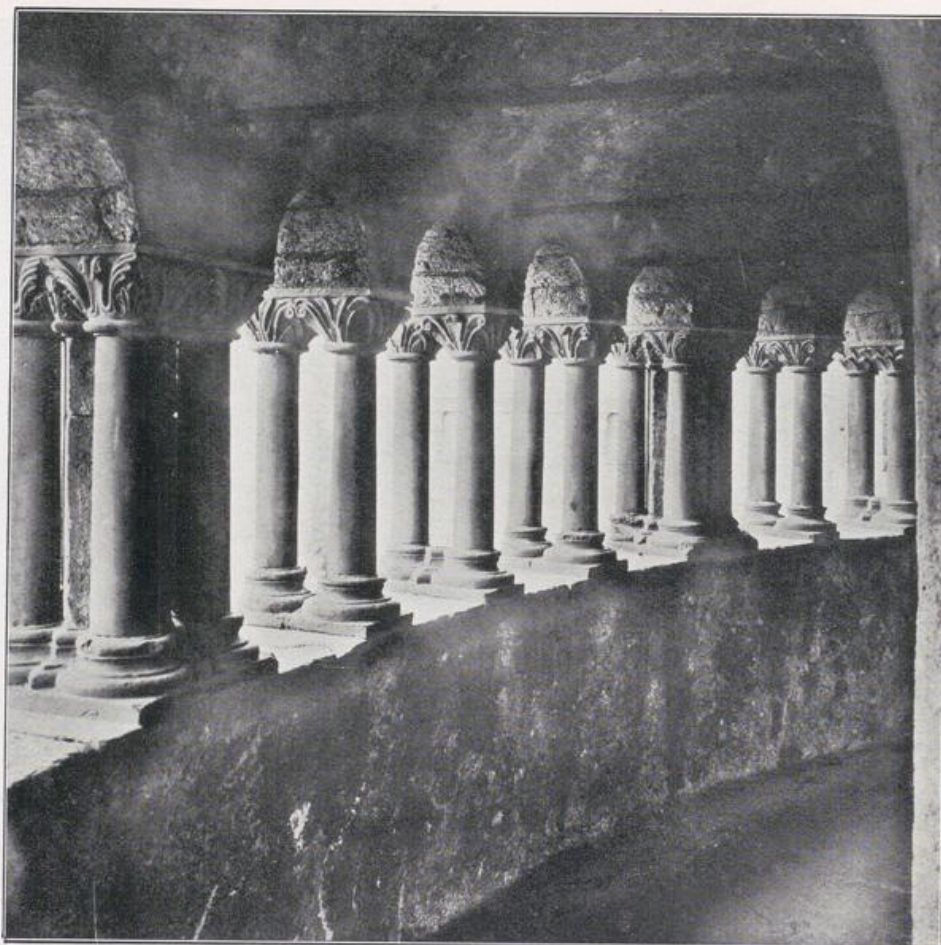
Köln — Gereonskirche.

Umgang der Zwerggalerie des Ostchores. Vgl. Außenansicht S. 95.