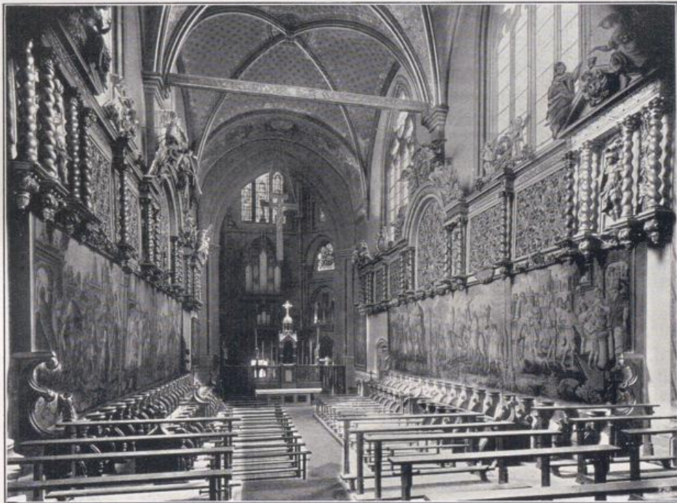
Köln — Gereonskirche.

Chor. — Für das Chorgestühl vgl. S. 104, für Wandteppiche und Reliquiare S. 108.