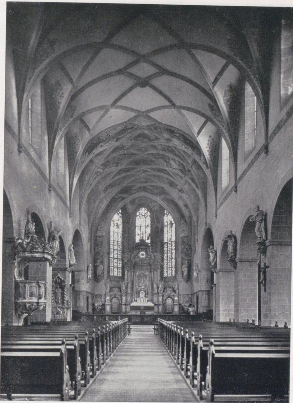
Köln — St. Pantaleon.

Langhaus 12. Jahrhundert, ursprünglich flach gedeckt. Gewölbe und Chor 1621. Gleicher Zeit Pfeilerplastiken, Kanzel und Altar.