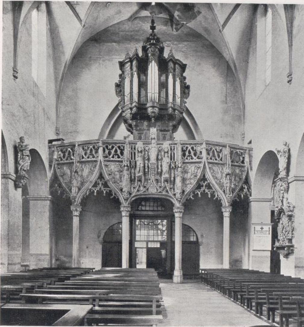
Köln — St. Pantaleon. Lettner um 1510.

bunt verglaste Chorfenster bricht sich gedämpft das Licht und überflutet den Altar (Bild S. 126). Diese farbenprächtigen Fenster sind das Schlußkapitel der Kölner Glasmalerei der Renaissance, die wir vorhin noch in St. Peter bewundern konnten. Und wenn man dann ermißt, wie wenig tief die Chorapsis ist, und welche reiche Tiefenwirkung diese genialen Barockdekorateure uns hier vorgezaubert haben, dann schweigt jedes Wort der Einzelkritik, und man läßt den Raum als Ganzes aus sich wirken.