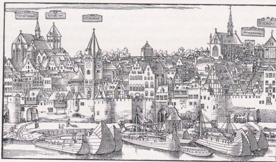
Köln — Ausschnitt aus dem Stadtprospekt von Anton Woensam von Worms vom Jahre 1531.

Durch die nördliche Vorhalle suchen wir den Weg wieder ins Freie zum Waidmarkt, wo das Leben aus der Severin- und Hohen Straße, aus dem Rotgerber- und Blaubach, aus dem Mühlenbach und Filsengraben zusammenströmt. Aber nicht die Fortsetzung der Severinstraße, die alte und enge, immer belebte Hohe Straße mit ihren neuzeitlichen Kauf- und Geschäftshäusern, Gaststätten und Kinos, ist unser Ziel, sondern durch den Mühlenbach und den Filsengraben zum Rhein, zu St. Maria Lyskirchen. Rechts im Filsengraben Nr. 18 das alte, hohe, mehrgeschossige Haus der Faßbinderzunft aus der zweiten Hälfte des 16. Jahrhunderts mit seinem barock verschnörkelten flandrischen Volutengiebel, den seitlich wappenhaltende Krieger bewachen (Bild S. 46, 2). Am Ausgang zum Rhein links die malerische Baugruppe alter Fachwerkhäuser mit weit vorkragendem Oberbau, den Säulen nach der Straße stützen müssen. So entstand ein bequemer, gegen Wetter geschützter Umgang, der in früheren Zeiten sich über die ganze eine Straßenseite erstreckte, die man daher „sub arcubus“ benannte. Links unten zum Rhein reckt St. Maria Lyskirchen über niedrige Wohnhäuser hinaus Chor und Chorturm empor (Bild S. 152, 153).