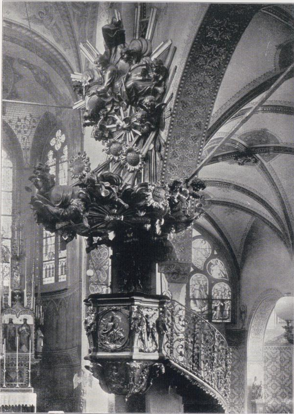
Köln — St. Johann Baptist.