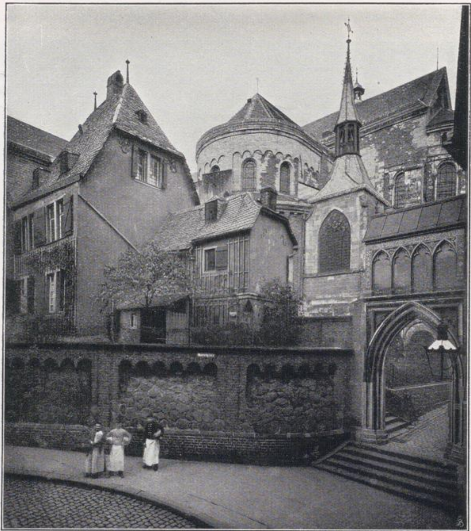
Köln — St. Maria im Kapitol.

Ansicht vom Marienplatz auf das Dreikönigentörchen (rechts, 14. Jahrh.) und das Singmeisterhäuschen (links, 15. Jahrh.). Vgl. Bild S. 161.