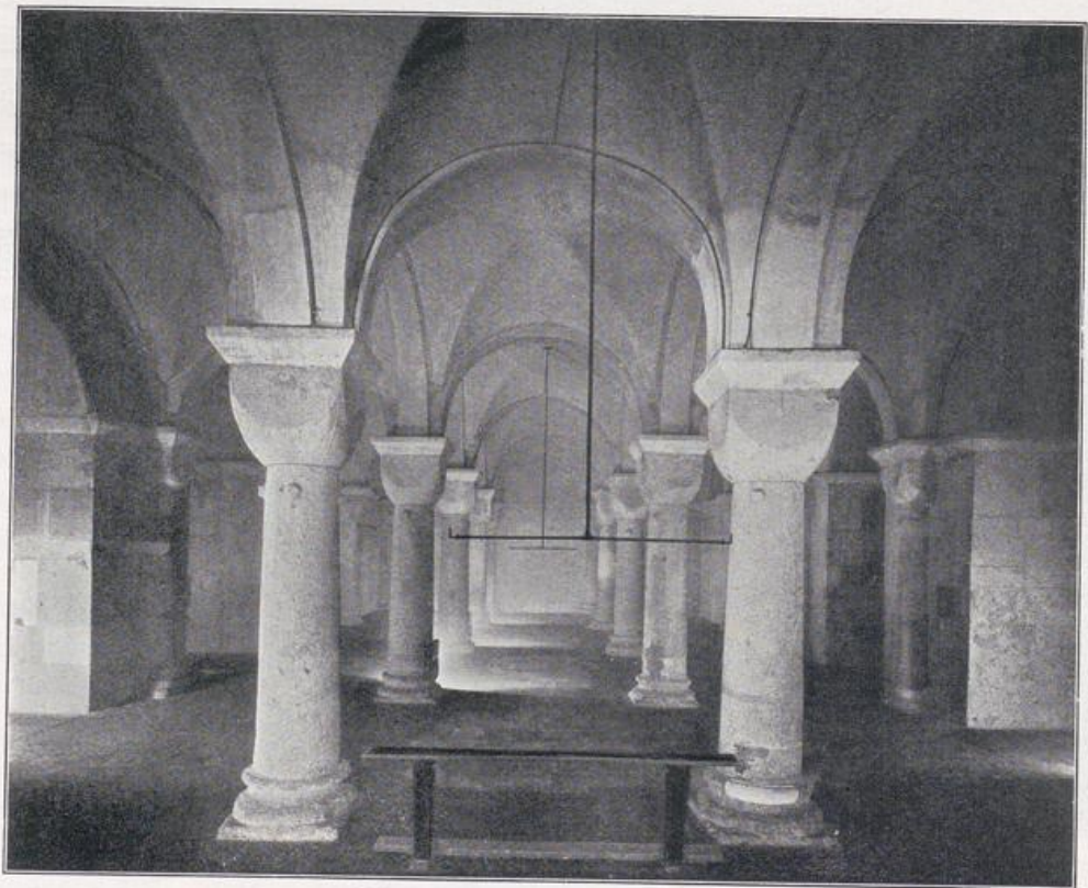
Köln — St. Maria im Kapitol. Krypta — 11. Jahrhundert.

kirchlichen Langhauses. Die Kirche wurde 1065 geweiht. Die grundrißliche Anordnung lag damals fest; über den Aufbau reden wir noch. Dieser Grundriß, epochemachend für die Entwicklung rheinisch-romanischer Baukunst — und das 150 Jahre vor St. Aposteln! (s. S. 110 ff.) —, vereinsamt dastehend zwischen römischer Antike und dem italienischen zentralen Denkmalsbau der Renaissance der Bramante und Lionardo, der in St. Peter zu Rom seinen stärksten Niederschlag fand, ist voller Rätsel. Der Name „im Kapitol“ und die starke Verwandtschaft des Ostchors der Kirche mit der auf antiken Fundamenten im Mittelalter und in der Renaissance aufgebauten Kirche San Lorenzo in Mailand führten dazu, was nur zu nahe lag, den rätselhaften Kölner Bau, da er sonst nirgendwo in die Bauentwicklung damaliger Zeit einzureihen war, so zu erklären: die Fundamente des römischen Kapitols zu Köln in derselben reichen Innengliederung der Konchen und Säulenstellungen wie der antike Grundriß von San Lorenzo in Mailand haben die Anlage von St. Maria im Kapitol diktiert. Zwar taucht der Name „in Capitolio“ erst hundert Jahre nach der Weihe der Marienkirche auf, und die alte Bezeichnung „Maria Alta“ blieb noch lange neben dem neuen Namen bestehen. Hier konnten also nur Ausgrabungen Aufschluß geben. Man stieß auch vor einigen Jahren auf umfangreiche Fundamente einer römischen Anlage, die wohl Zusammenhang zeigte mit dem