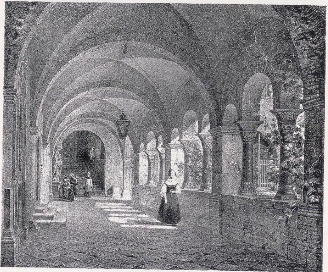
Köln — St. Maria im Kapitol.

Älter als Langhaus und Chor ist in der Anlage der Westbau (Bild S. 171). Er soll noch auf einen Kirchenbau des 10. Jahrhunderts unter Erzbischof Bruno zurückgehen. Nach dem Vorbilde der Pfalzkapelle Karls des Großen zu Aachen und des