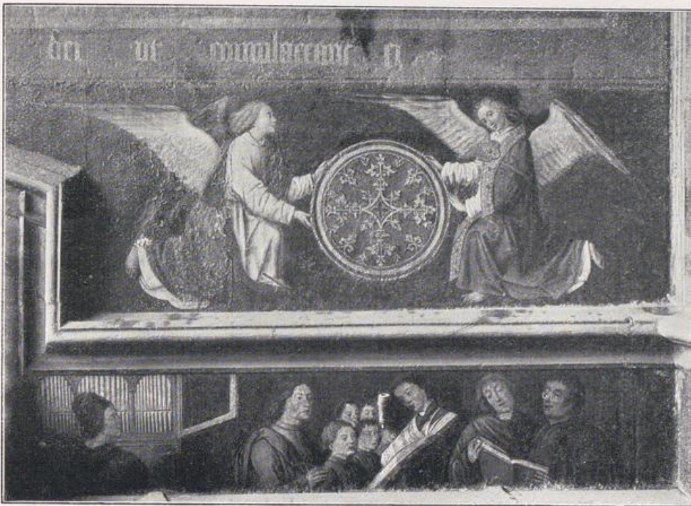
Köln — St. Maria im Kapitol.

Die Hardenrathsche Sängerschar. — Ausschnitt aus der Wandmalerei der Hardenrathskapelle.