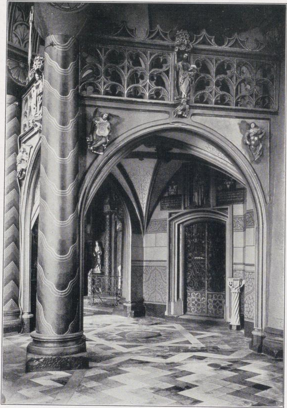
Köln — St. Maria im Kapitol.

Sängertribüne vor der Hardenrathskapelle im Umgang des südlichen Querarmes, 15. Jahrhundert.