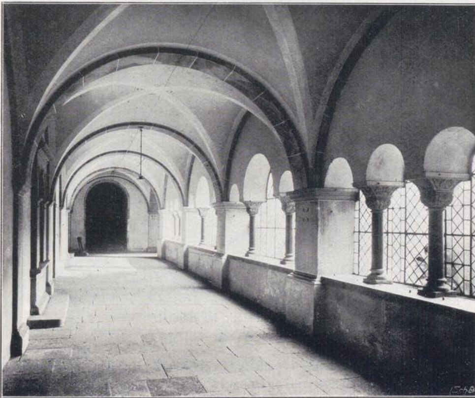
Köln — St. Maria im Kapitol.

Die Hardenrathskapelle ist das schönste Schmuckstück der ganzen Kirche und von einer köstlich anheimelnden Stimmung erfüllt, da noch die alte Aus-