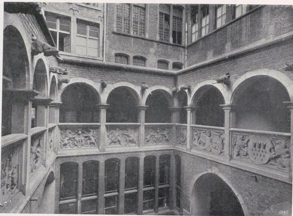
Köln — Rathaus.

Löwenhof. Erbaut 1540 von Meister Lorenz. — Vgl. Bild S. 203.