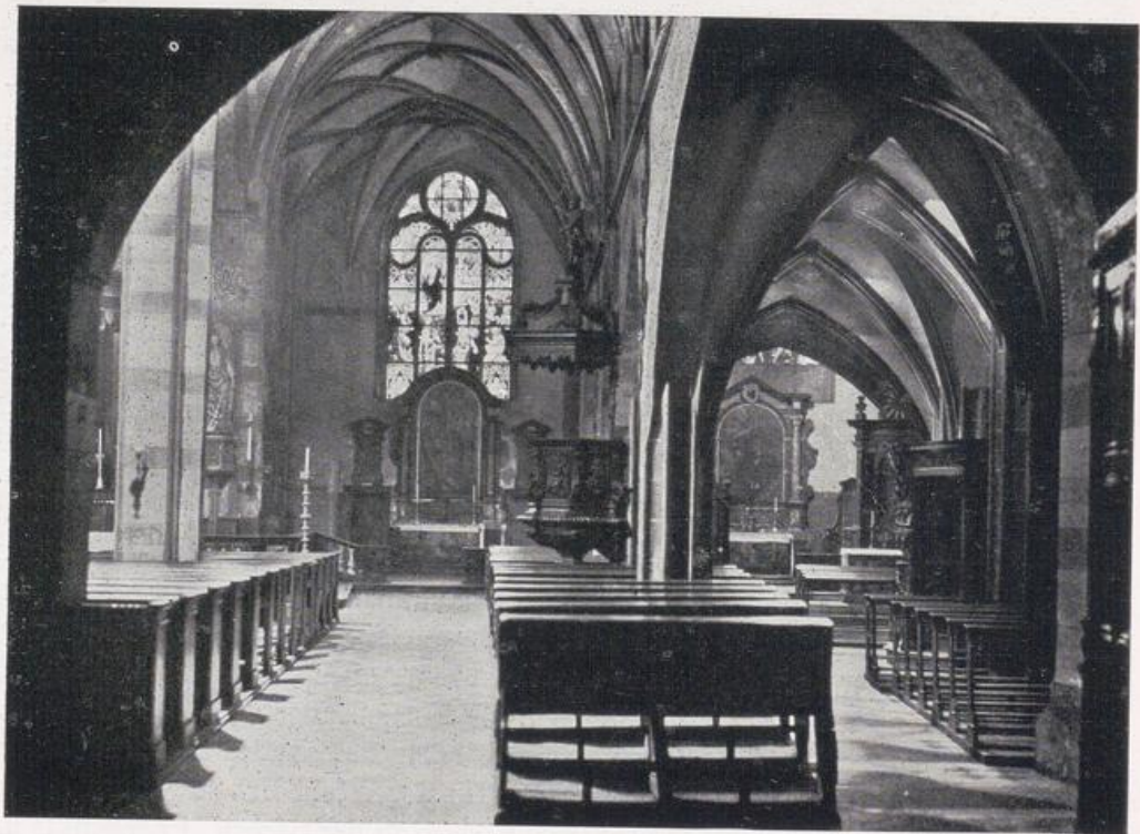
Köln. — St. Kolumba. — Blick in die beiden südlichen Seitenschiffe. 15. Jahrhundert.

St. Kolumba, Kölns beliebte Pfarrkirche, war früher reich an herrlichen Ausstattungsstücken. Da war Roger van der Weydens großer Flügelaltar mit der Anbetung der heiligen drei Könige, ein Tryptichon des Kölner „Sippenmeisters“ mit der Darstellung der Beschneidung Christi, der Bartholomäusaltar des sogenannten Kölner