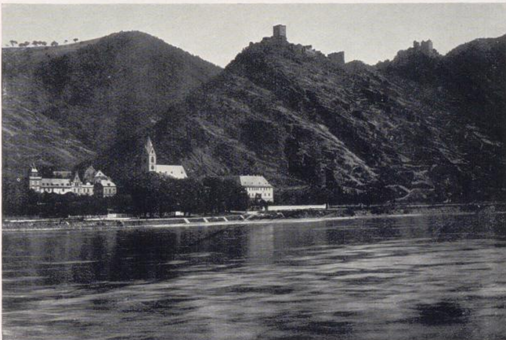
Bornhofen und die „Feindlichen Brüder“. Burgruinen Sterrenberg und Liebenstein (vgl. Bild S. 162, 161 a, 160).

Nur wenige Kilometer von Bornhofen entfernt, auch am rechten Ufer gelegen, das liebliche Camp. Das ist wirklich ein malerisches Nest, dessen man sich immer freut, wenn einen der Dampfer vorüberrauscht. Um das Kirchlein, leider heute infolge Neubaus im Herzen des Ortes aufgegeben und mehr und mehr verfallend, sammeln sich die alten Klosterbauten, auch heute ihrem alten Zweck entfremdet. Hier saßen schon im 14. Jahrhundert Augustinerinnen, und dann bis 1806 Franziskanerinnen. Links vom Kirchturm zum Strom ist vorgeschoben der Seitenbau, sein Fachwerkobergeschoß mit seitlichen Ecktürmchen belebt; und ähnlich malerisch, auch nahe der Kirche, wie bei französischen Schloßbauten, steilsteigend das Dach des Wörth'schen Hofes. Unter der Nonnenempore, die Kirchturm und Kloster verbindet, führt eine gewölbte Durchfahrt zum Kirchplatz, links vorbei an einem Renaissanceportal, das in das Kloster einladet (Bild S. 164). Trotz allen Verfalles, alles von hohem Reiz, auch das Innere der aufgegebenen Kirche. Im Orte der stattliche Leyensche Hof. — Aber das muß man erleben, wenn sich das Obstnest in das Weiß seiner Blüte bettet und in dem verlassenen Ort in der frühen Zeit der Obstblüte nur hin und wieder vereinzelt erscheinen Kurgäste vom andern Ufer, aus Bad Boppard.