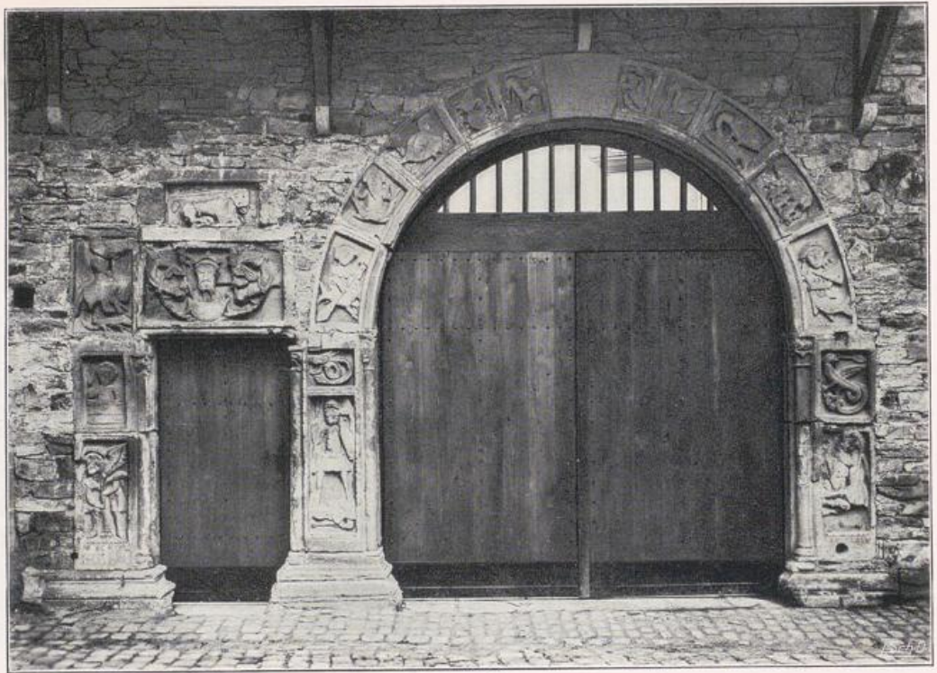
Remagen. Pfarrhausportal. Anfang 12. Jahrh.