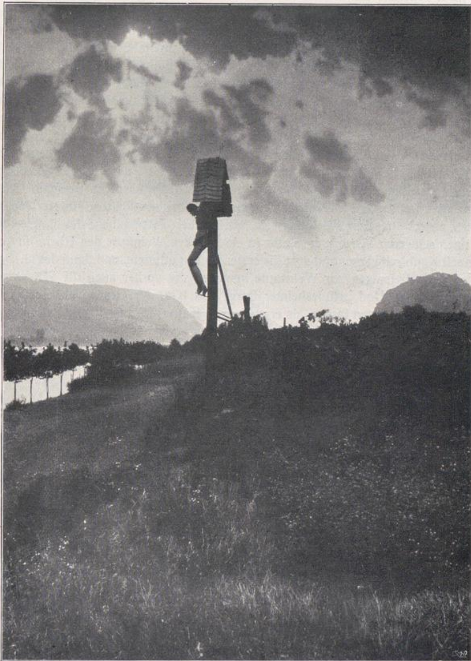
Wegekreuz am Mittelrhein. Im Hintergrunde rechts Burgruine Hammerstein.