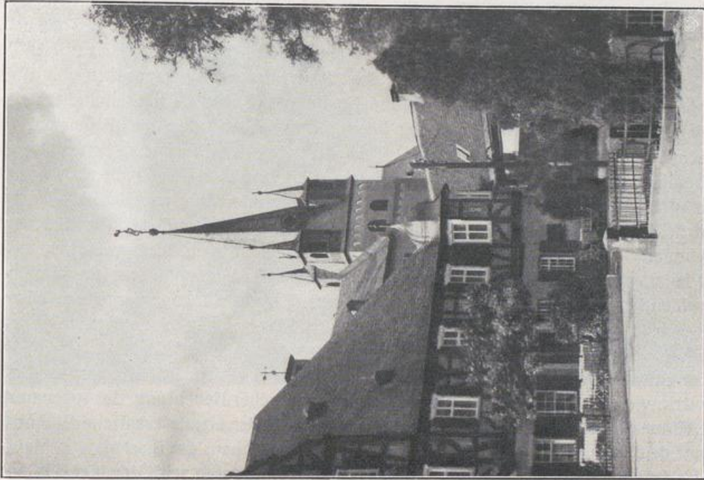
Oestrich. Gasthaus „Zum Schwan“ (1628) — vgl. Bild S. 54 — und romanischer Turm (12. Jahrh.) der Pfarrkirche.