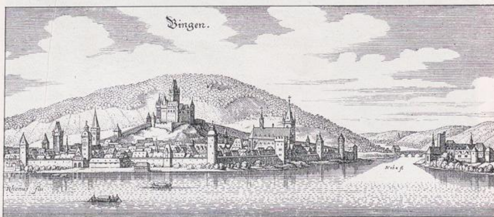
Bingen. Nach Merians Topogr. Archiep. Mogunt. 1646 Auf der Anhöhe Burg Klopp. Zerstört 1789 von den Franzosen (vgl. Bild S. 80 u. 81 2 ). Am Naheufer Martinskirche (vgl. Bild S. 80 u. 81 2 ).

B ingen und die Nahemündung auf der gegenüberliegenden Rheinseite bewachte früher die Burg Klopp. Sie steht auf den Fundamenten einer römischen Befestigung, von der noch der 52 Meter tiefe Brunnen im Burghof erhalten ist. Die mittelalterliche Burg war der Sitz des erzbischöflichen Vogts von Mainz. Hier wurde Kaiser Heinrich IV. am 23. Dezember 1105 von seinem unnatürlichen Sohn gefangengenommen, am Weihnachtstage nach Burg Böckelheim abgeführt, dann nach der Kaiserpfalz zu Ingelheim, wo er gezwungen wurde, der Krone zu entsagen (s. S. 62). Von Burg Klopp herab zogen sich dem fallenden Burghügel entlang