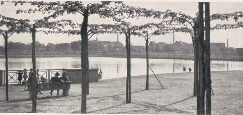
Köln — Wasserbecken an der Aachener Straße. Fortsetzung von S. 16.